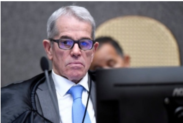
Ministro Saldanha Palheiro votou com a divergência em julgamento da 3ª Seção Rafael Luz/STJ