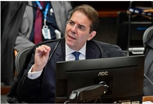
Ministro Ribeiro Dantas votou na linha do precedente do Supremo Tribunal Federal Emerson Leal