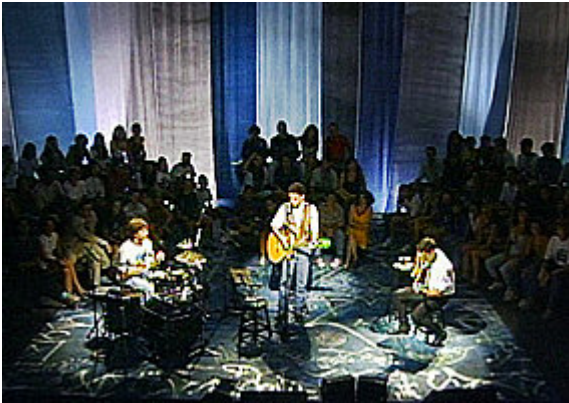
Legião Urbana terminou com a morte do vocalista, Renato Russo, em 1996