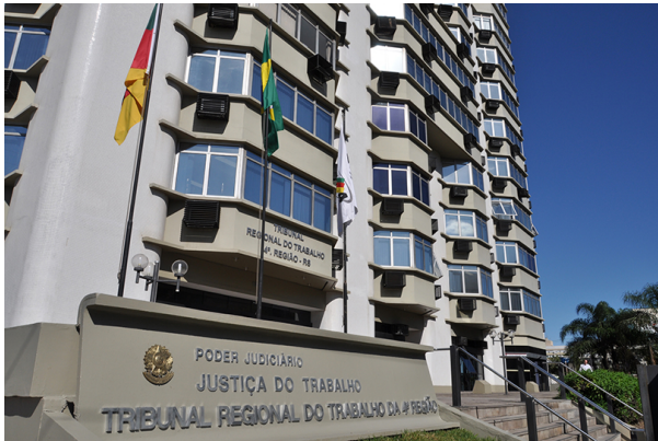
Sede do TRT-4 em Porto Alegre

A OAB-RS tomou conhecimento de que o TRT-4 vem discutindo internamente a possibilidade de suprimir as transcrições e considerar como registro válido apenas as gravações das audiências. De acordo com a seccional, isso violaria os princípios do contraditório, do devido processo legal e da celeridade processual.