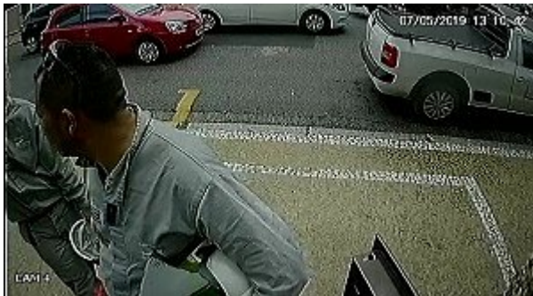
Imagem distribuída nas redes sociais