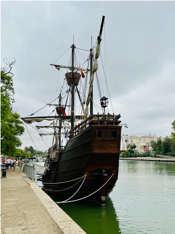
Réplica da nau do navegador Fernão de Magalhães, em Lisboa

A expedição de Fernão de Magalhães passou pelo Brasil e foi pioneira ao alcançar a Terra do Fogo, no extremo sul do continente americano (atualmente parte de Argentina e Chile), atravessar o estreito que hoje leva seu nome (Chile) e cruzar o Oceano Pacífico, que foi nomeado por ele.