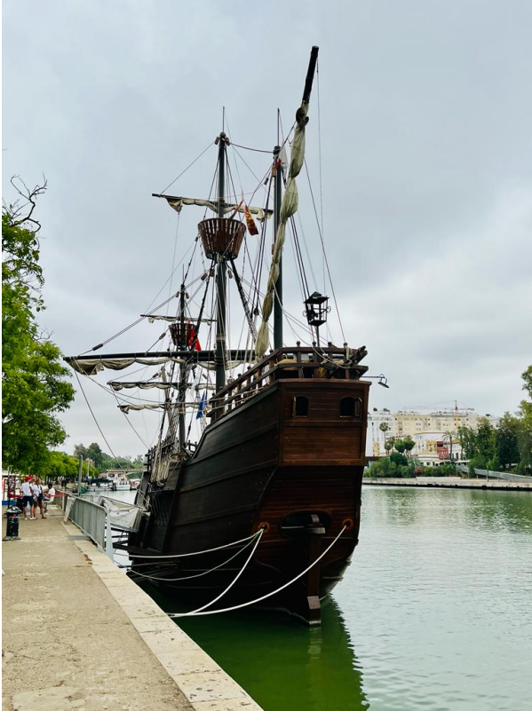
Réplica da nau do navegador Fernão de Magalhães, em Lisboa

A expedição de Fernão de Magalhães passou pelo Brasil e foi pioneira ao alcançar a Terra do Fogo, no extremo sul do continente americano (atualmente parte de Argentina e Chile), atravessar o estreito que hoje leva seu nome (Chile) e cruzar o Oceano Pacífico, que foi nomeado por ele.