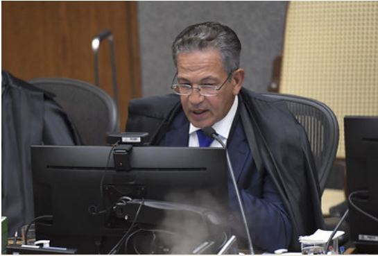
Ministro Mauro Campbell propôs tese mais abrangente e recusou modulação dos efeitos

Já o parágrafo único acrescentou que o mesmo limite se refere às contribuições parafiscais arrecadadas por conta de terceiros. Elas se destinam às instituições do Sistema S — Sesc, Sebrae, Sesi, Senai e outras.