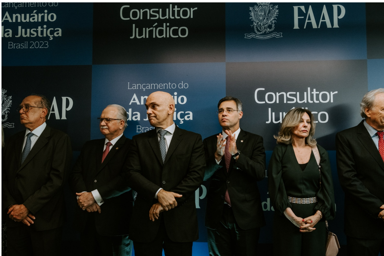
Dispositivo de honra: ministros Gilmar Mendes, Edson Fachin, Alexandre de Moraes, André Mendonça e a vice-procuradora-geral da República Lindôra Araújo