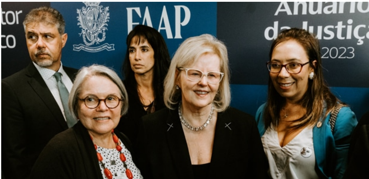
Ministra Rosa Weber, presidente do Supremo Tribunal Federal e do Conselho Nacional de Justiça, esteve no evento