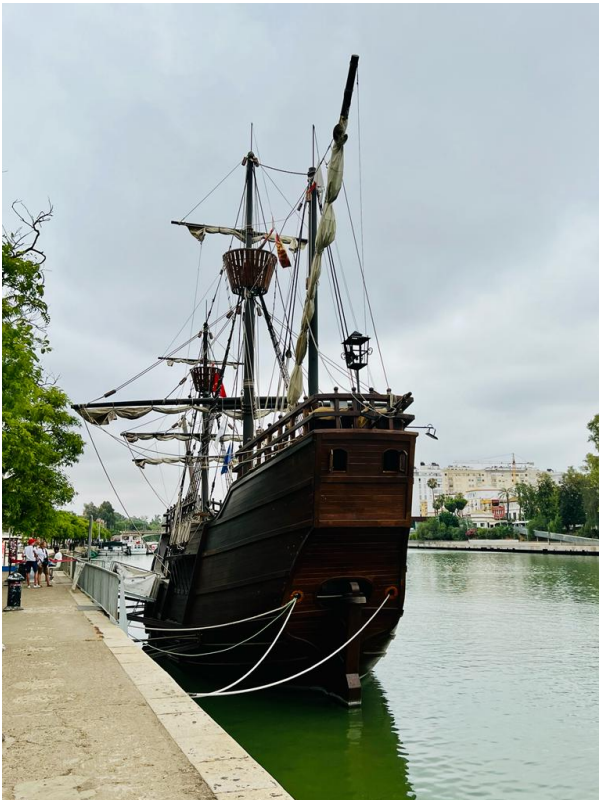
Réplica da nau de Fernão de Magalhães Reprodução

Meio milênio depois, no livro Direito Marítimo: estudos em homenagem aos 500 anos da circum-navegação de Fernão de Magalhães , o ministro do Supremo Tribunal Federal Ricardo Lewandowski reconstituiu a expedição de Magalhães ao mesmo tempo em que traz à tona discussões atuais e relevantes do Direito Marítimo.