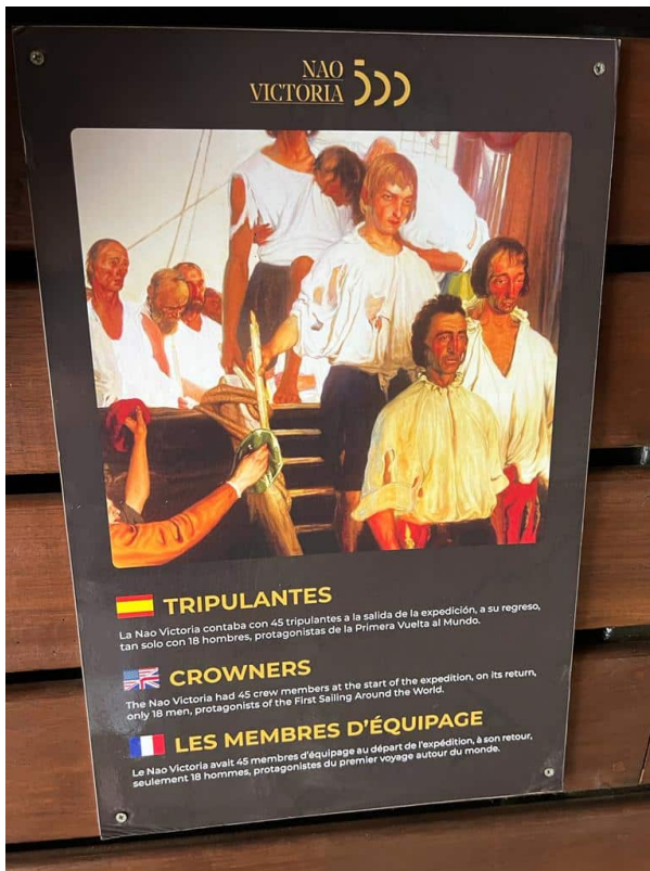
Os tripulantes da nau usada pela circum-navegação de Fernão de Magalhães ConJur

"Rememorar tal conquista é uma forma de demonstrar à geração atual e às futuras que os grandes eventos disruptivos da civilização impõem a predominância do bem comum, sacrifícios, coragem, engenhosidade e elevada capacidade de liderança", afirma o militar.