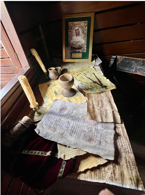
Réplica do interior da nau de Fernão de Magalhães ConJur