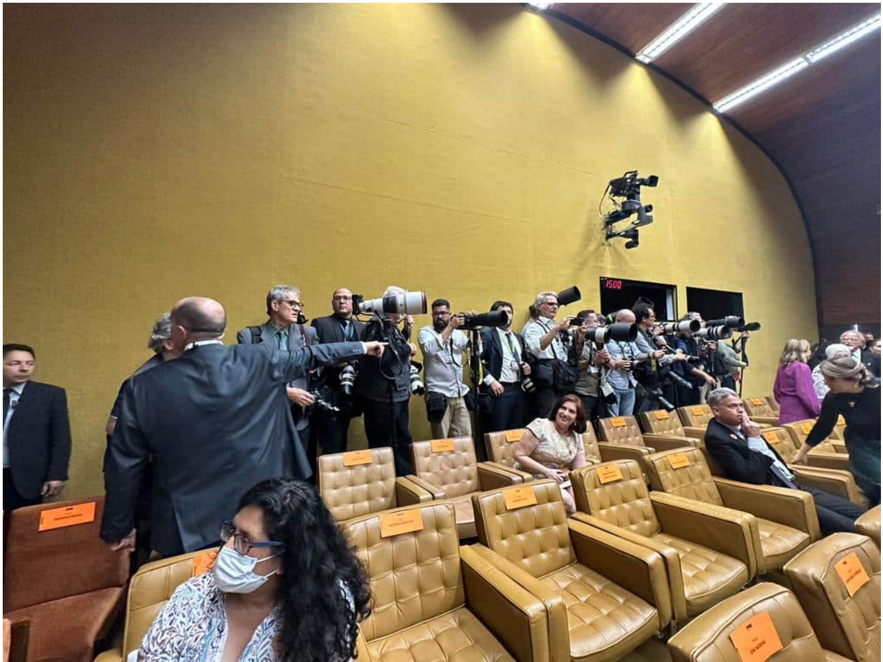
Fotógrafos se alinham durante cerimônia de posse de Luís Roberto Barroso como presidente do Supremo ConJur