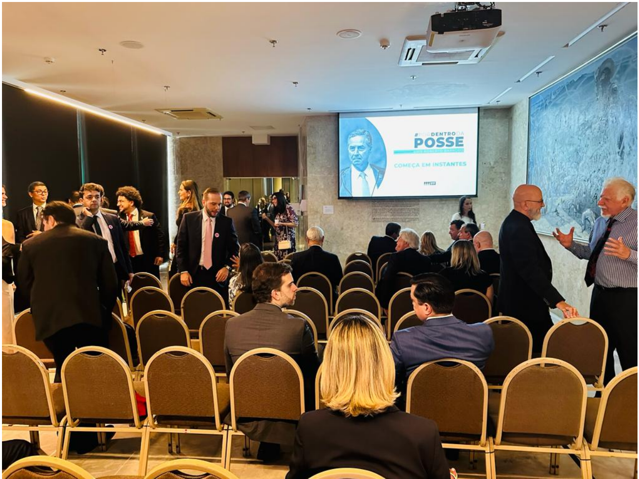
Convidados e convidadas durante posse do ministro Luís Roberto Barroso como presidente do STF