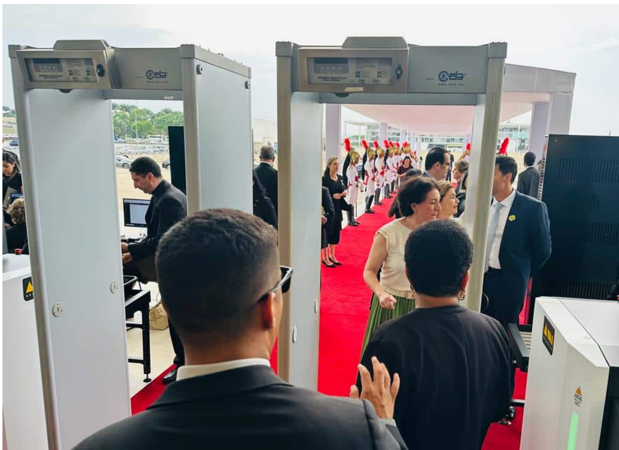
Fila para entrada na posse do ministro Luís Roberto Barroso como presidente do Supremo Tribunal Federal