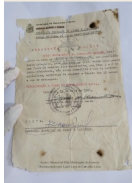
Documentos encontrados no Memorial Mãe Menininha mostram restrições policiais ao candomblé