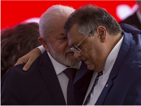
Decreto foi assinado pelo presidente Lula e pelo ministro da Justiça, Flávio Dino, que está prestes a assumir vaga no STF

Já o trecho sobre preservação do local do crime é, segundo ele, “completamente genérico”, pois a ideia de contribuir “quando possível” é “vaga e imprecisa, além de subjetiva”. Na sua visão, o artigo deveria, no mínimo, “criar um dever legal de preservação do local do crime até a chegada dos peritos ou da autoridade com poder de polícia judiciária”.