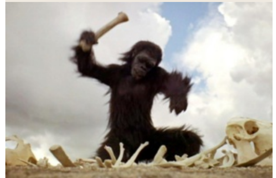
Cena do filme "2001 — Uma Odisseia no Espaço", de Stanley Kubrick