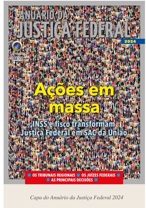
Capa do Anuário da Justiça Federal 2024

É muito natural que a União seja o principal cliente da Justiça Federal, pois cabe a esse ramo do Judiciário julgar as causas baseadas na legislação federal. Mas não é tão natural assim que a União seja parte em um volume tão espetacular de processos. Contribui para a avalanche de ações com origem nas repartições públicas federais a complexidade das leis, bem como a ineficiência de parte do serviço público.