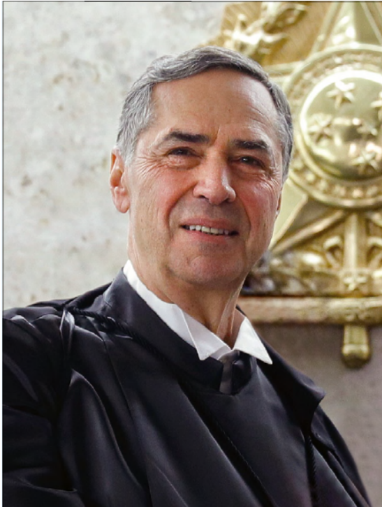
TRF-3 tem 29% de todo o acervo da Justiça Federal

Mas o fantasma da “lava jato” ainda assombra a 13ª Vara de Curitiba e o próprio TRF-4, responsável por referendar as condenações posteriormente anuladas. No fechamento desta edição do Anuário da Justiça Federal , em abril de 2024, o Conselho Nacional de Justiça, por 9 votos a 6, decidiu afastar temporariamente dos cargos os desembargadores Thompson Flores e Loraci Flores de Lima, que passaram a integrar a 8ª Turma com a saída dos seus antigos membros. Depois de correição na corte, o corregedor nacional de Justiça, ministro Luis Felipe Salomão, entendeu ser necessário afastá-los, por acusação de descumprimento de decisões do STF, fato que, afirmou, provoca um “caos no sistema de Justiça” e “corrói a democracia”. No dia seguinte à sua decisão monocrática, o CNJ se reuniu e manteve o afastamento. O Conselho, entretanto, revogou a decisão de também afastar a juíza Gabriela Hardt, que atuou na 13ª Vara Federal de Curitiba, e o juiz Danilo Pereira Júnior, atual titular da vara, que deve ser transformada em juízo das garantias.