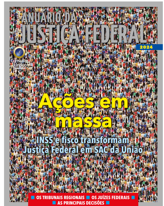
Capa do Anuário da Justiça Federal 2024