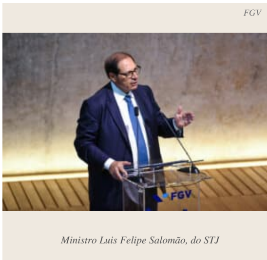
Ministro Luis Felipe Salomão, do STJ

O ministro Salomão relatou recurso no qual o STJ se pronunciou sobre a responsabilidade pelo conteúdo transmitido pelas emissoras de televisão. No julgamento do REsp 1.517.973 , os ministros da 4ª Turma condenaram a TV e Rádio Jornal do Comercio Ltda. a pagar dano moral coletivo por humilhar menores em um quadro sobre investigação de paternidade. Para o relator, o programa contribuía para tornar crianças e adolescentes vulneráveis a discriminações e vítimas potenciais de bullying .