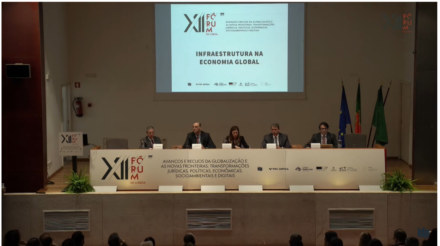
Painel sobre infraestrutura no XII Fórum Jurídico de Lisboa, em 2024

Lira disse que “o Parlamento brasileiro tem sabido responder ao desafio de permanente atualização com respeito à pluralidade de visões existente na sociedade brasileira”.