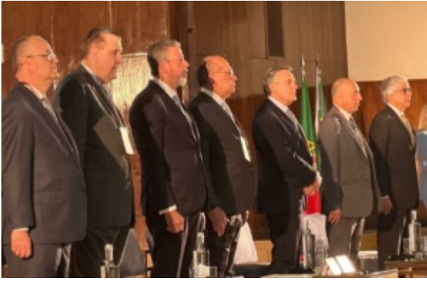
Arthur Lira e Gilmar Mendes entre os participantes da mesa de abertura do XII Fórum de Lisboa ConJur