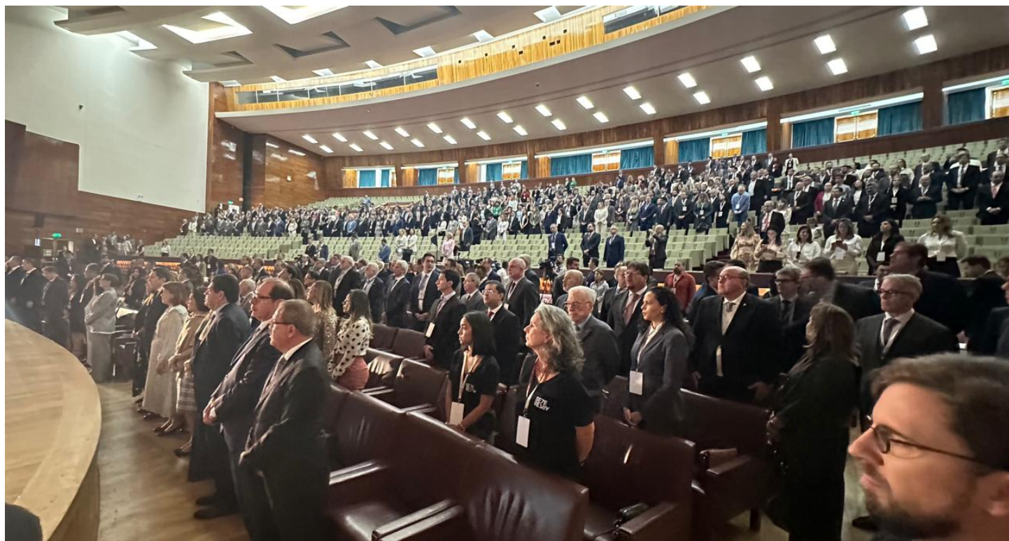
Plateia do primeiro dia do XII Fórum Jurídico de Lisboa de 2024 ConJur