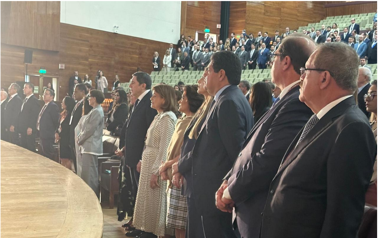
Autoridades do Judiciário, Executivo e Legislativo marcaram presença no XII Fórum de Lisboa ConJur