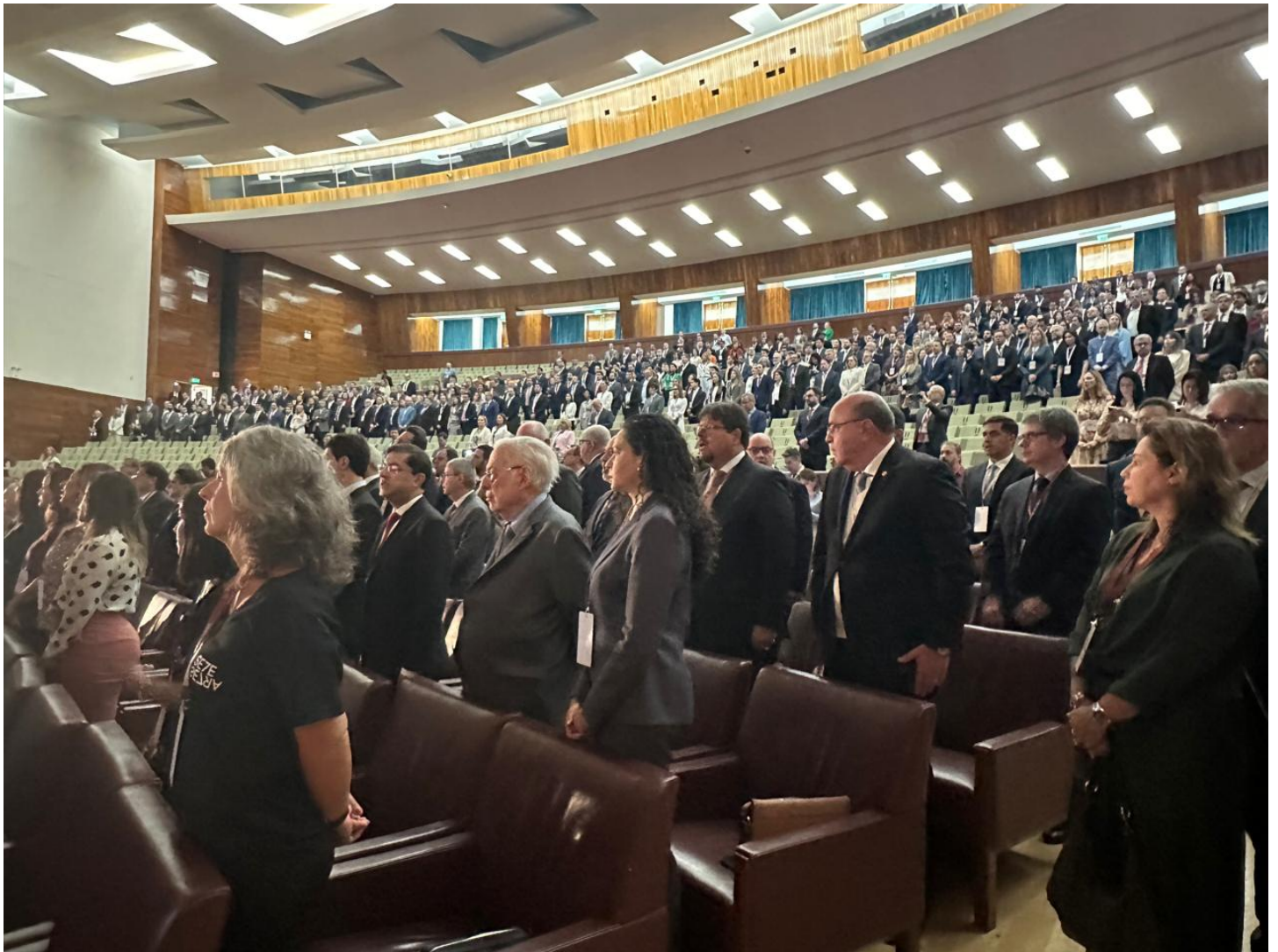
Plateia do primeiro dia do XII Fórum Jurídico de Lisboa de 2024