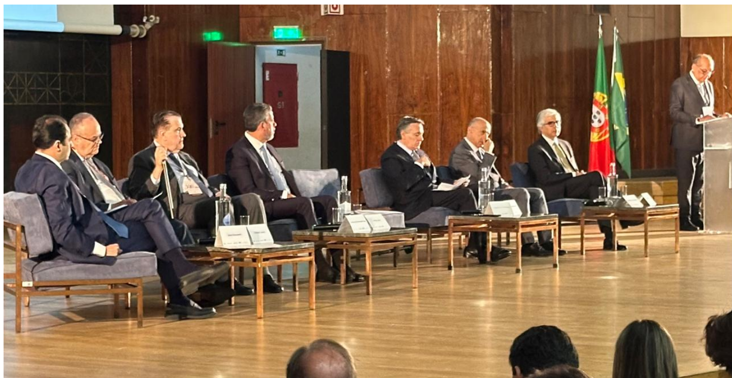
Autoridades políticas de Portugal e Brasil abrem programação do XII Fórum de Lisboa ConJur