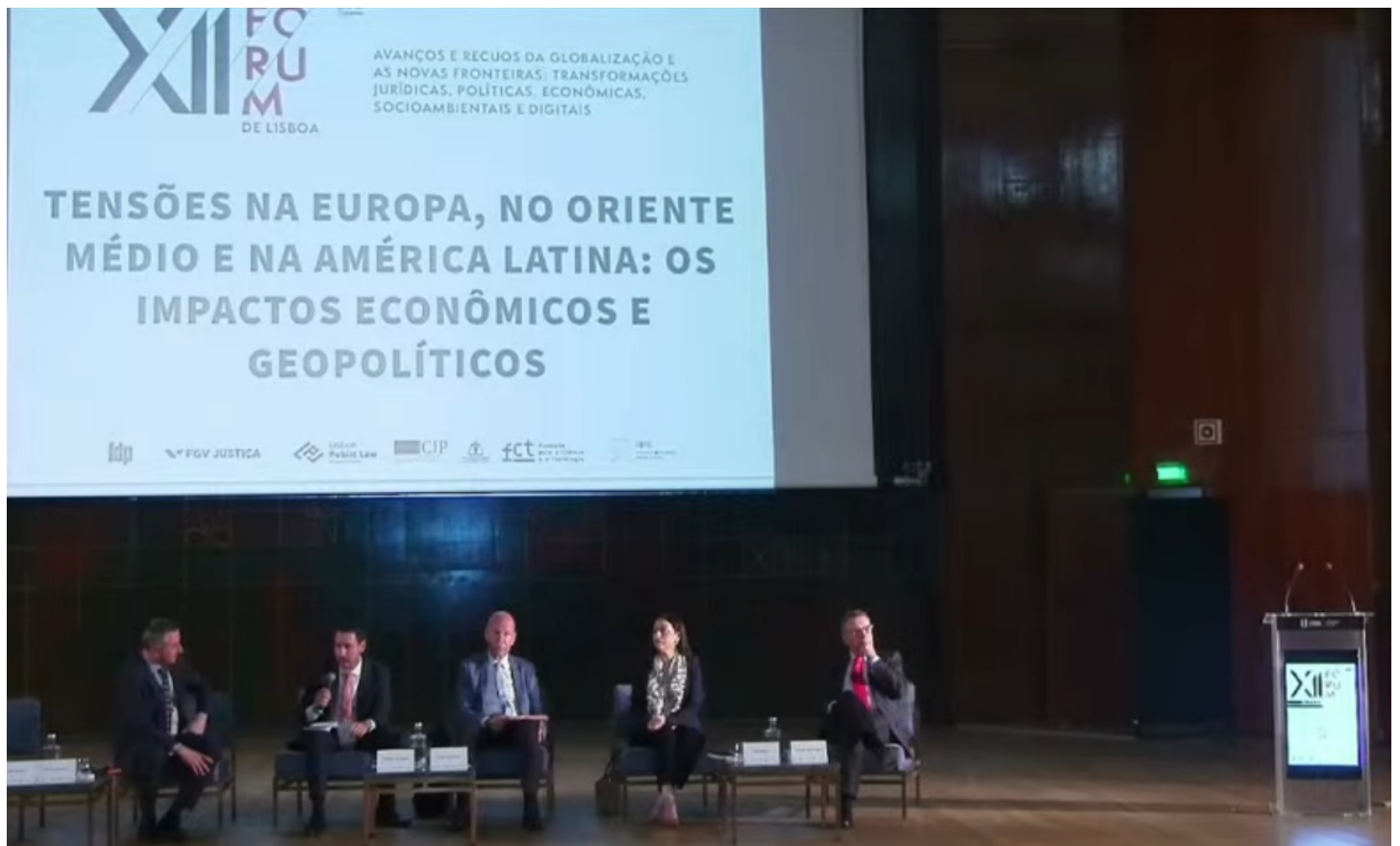
Painel sobre tensões na Europa e no Oriente Médio reúne especialistas