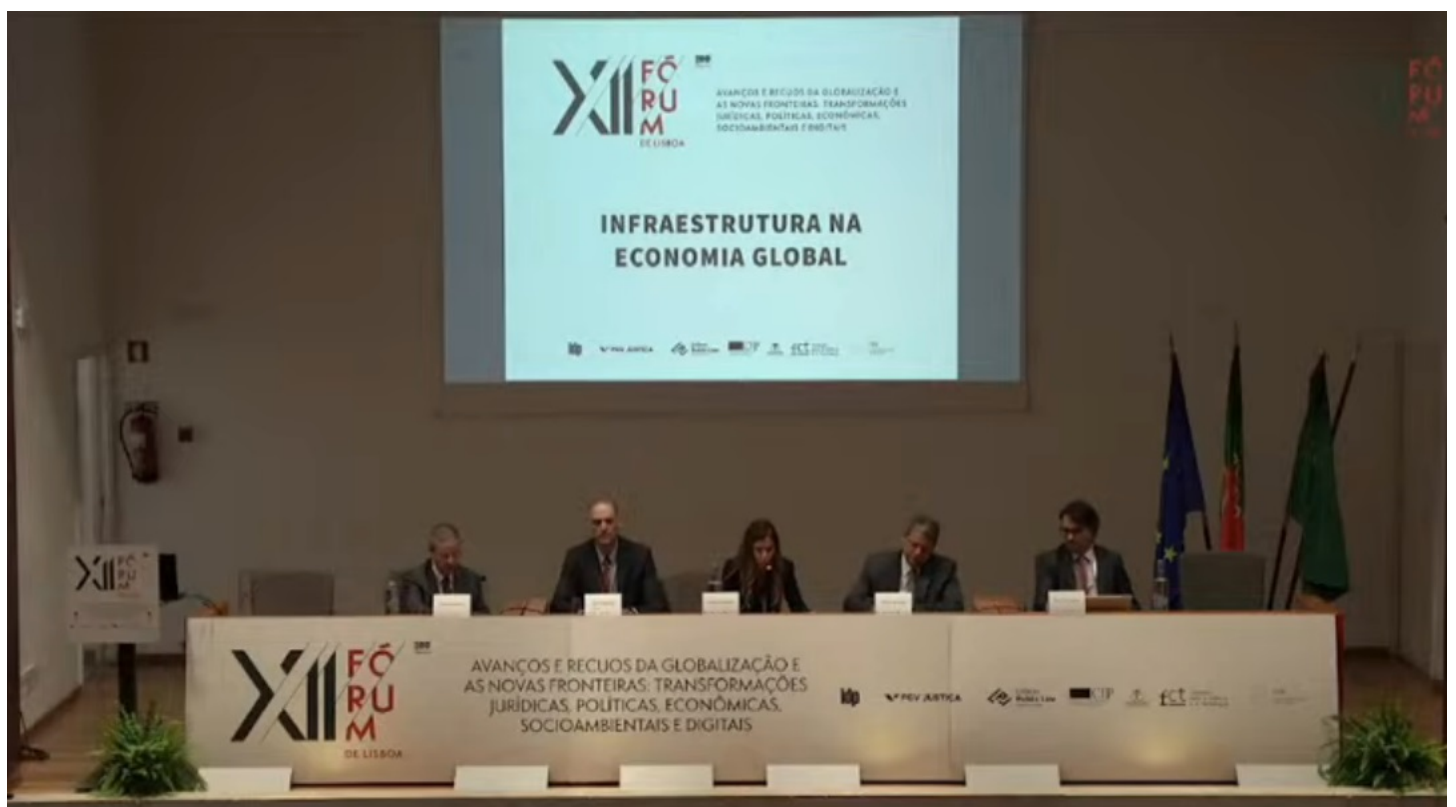
Painel com autoridades brasileiras e portuguesas debate infraestrutura na economia global