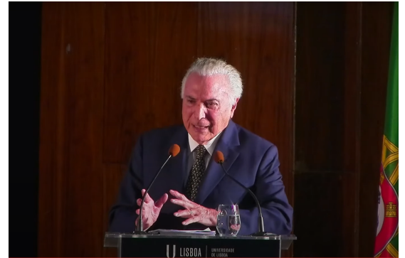
Michel Temer debateu as fissuras do presidencialismo de coalizção em Lisboa

“A governança no mundo constitucionalista se apoia numa divisão de poderes, dos quais dois ( Executivo e Legislativo ) são expressamente poderes políticos e devem exprimir o povo, sem que isso signifique que o terceiro poder ( Judiciário ) não tem uma dignidade”, continuou o professor.