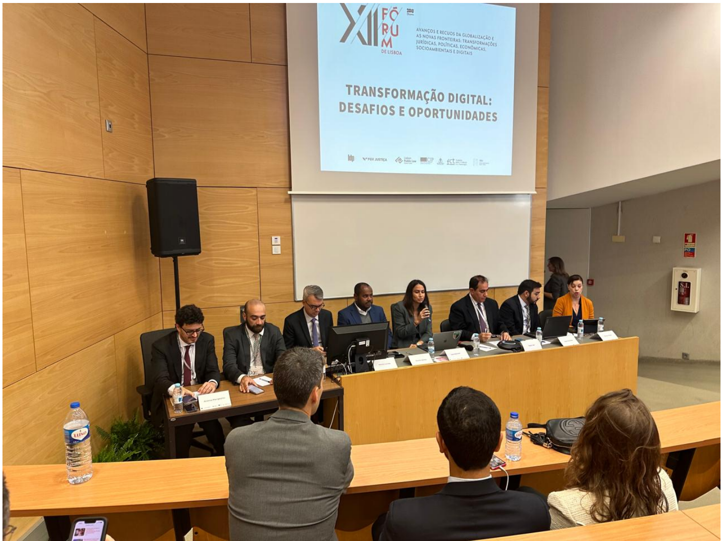
Painel reúne especialistas para debater desafios e oportunidades da transformação digital ConJur