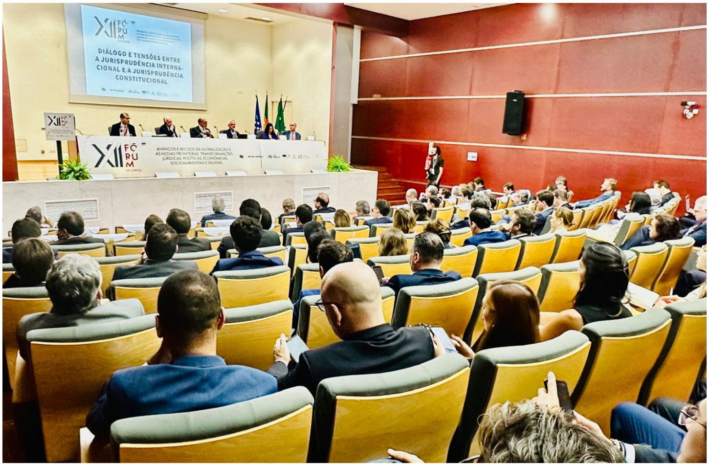
Plateia enche auditório em painel sobre jurisprudência internacional no Fórum de Lisboa ConJur