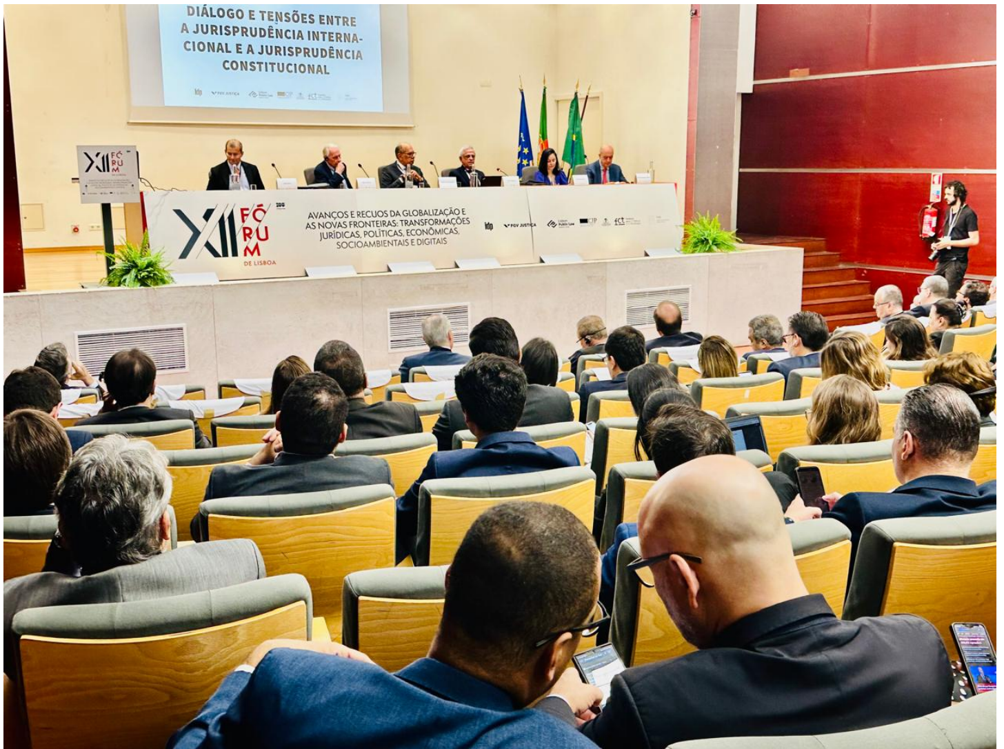
Gilmar Mendes faz moderação de diálogo entre representantes da Justiça da Europa e do Brasil ConJur