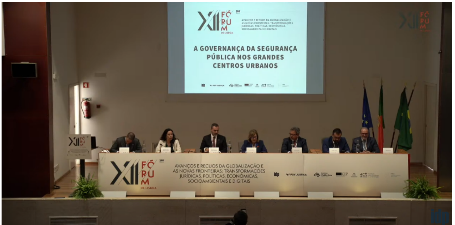
Mesa em Lisboa discutiu importância da Constituição no combate às ameaças antidemocráticas