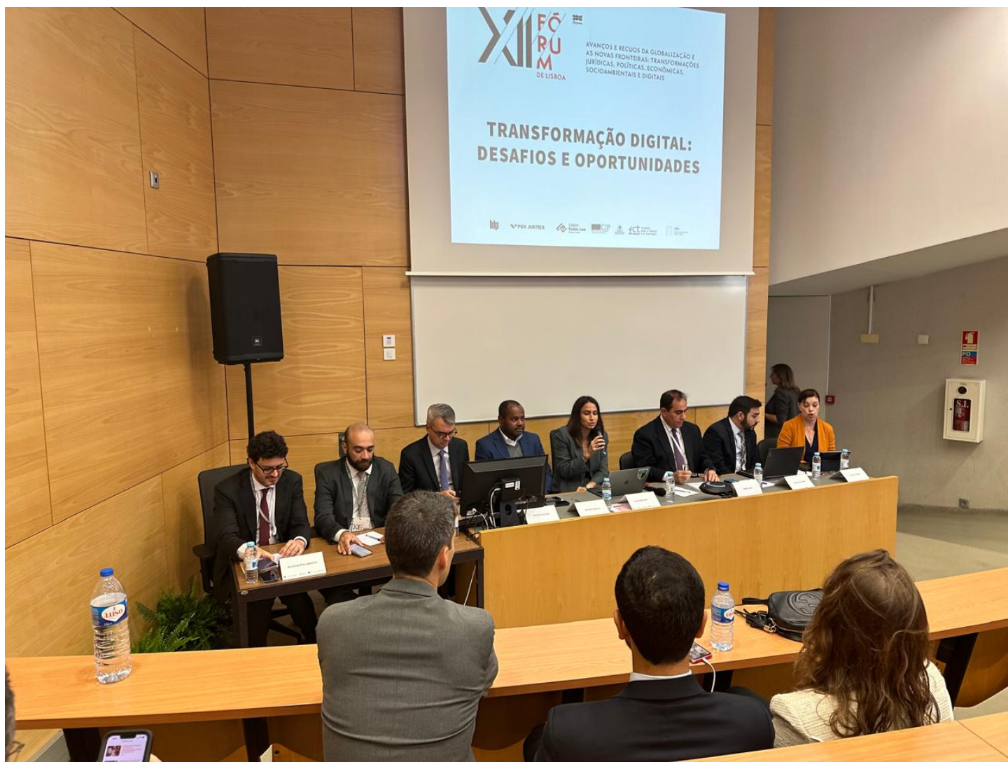
Painel reúne especialistas para debater desafios e oportunidades da transformação digital ConJur