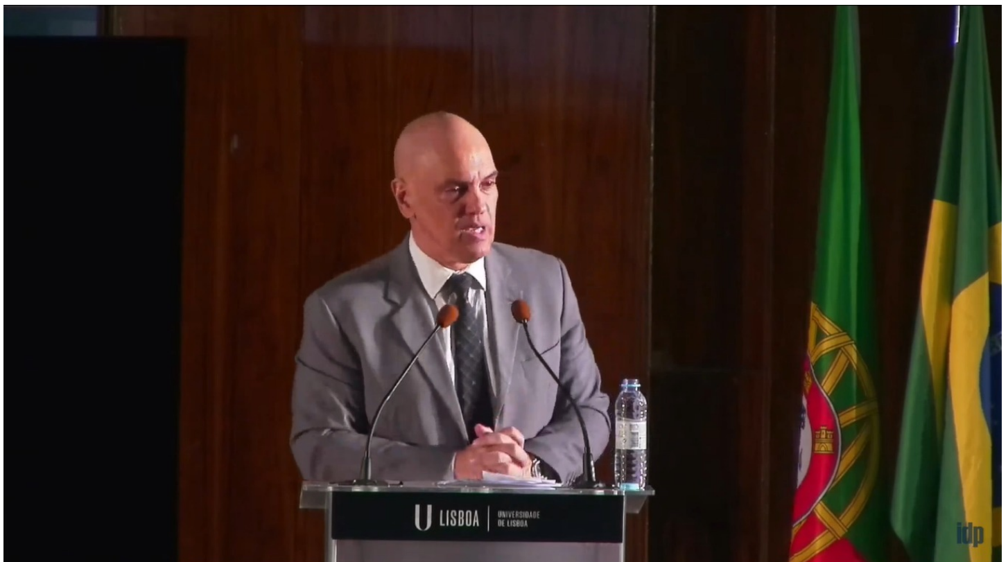
Ministro Alexandre de Moraes, do STF, durante painel sobre “O Mundo em Eleições e o Futuro da Democracia Representativa” no XII Fórum de Lisboa