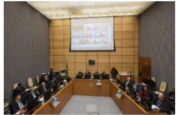
1ª Seção entendeu que valor da Selic se insere no conceito amplo de receita

E o mais recente “porém” para o gozo da “tese do século” foi aquele imposto pelo STJ.