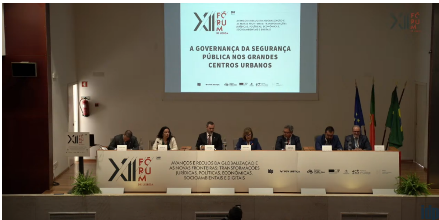
Mesa em Lisboa discutiu importância da Constituição no combate às ameaças antidemocráticas