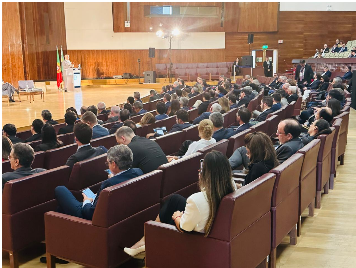
Último dia do XII Fórum Jurídico de Lisboa teve debates no auditório da reitoria da faculdade ConJur