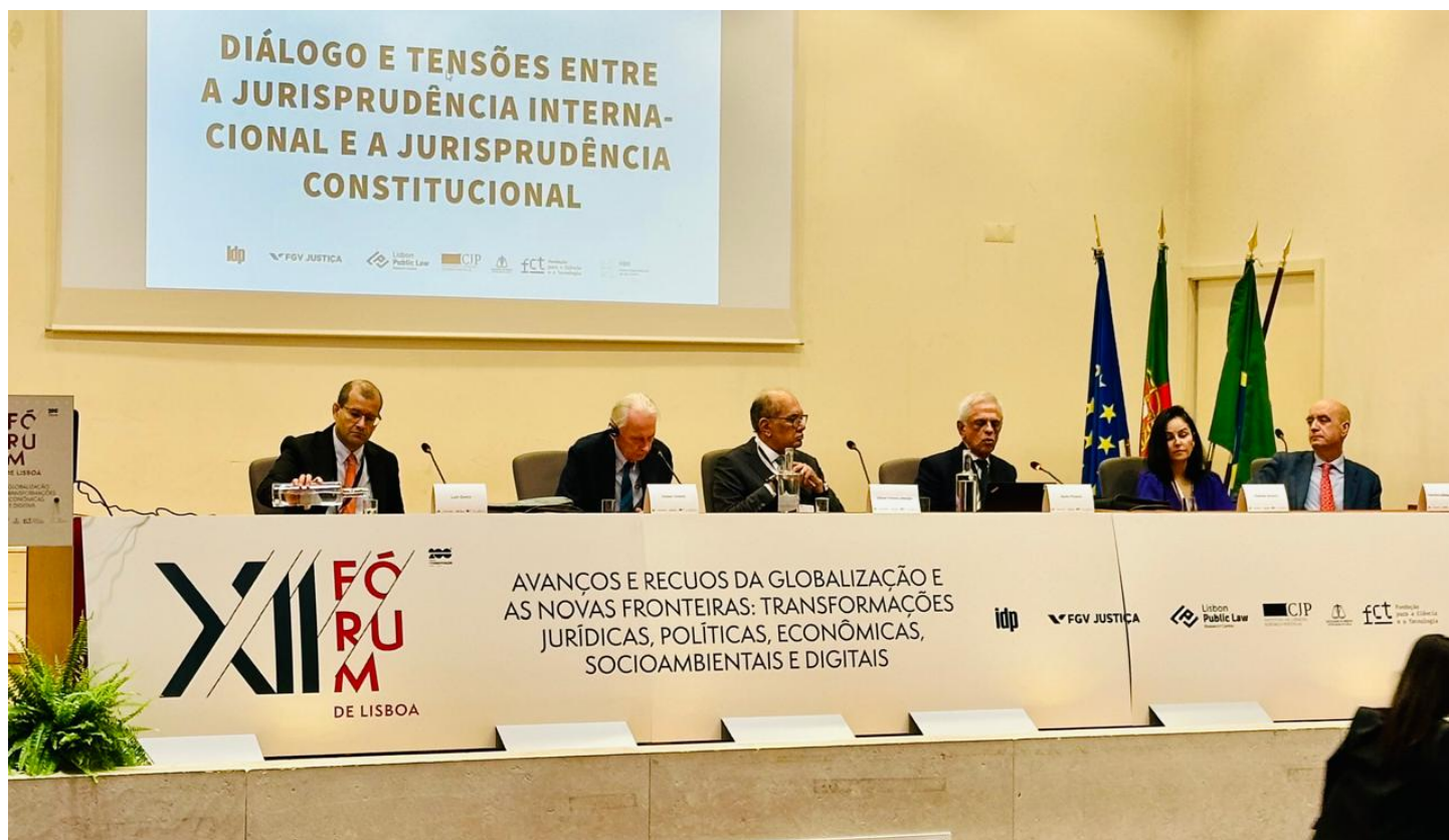
Mesa completa para debater tensões entre a jurisprudência internacional e a jurisprudência constitucional ConJur