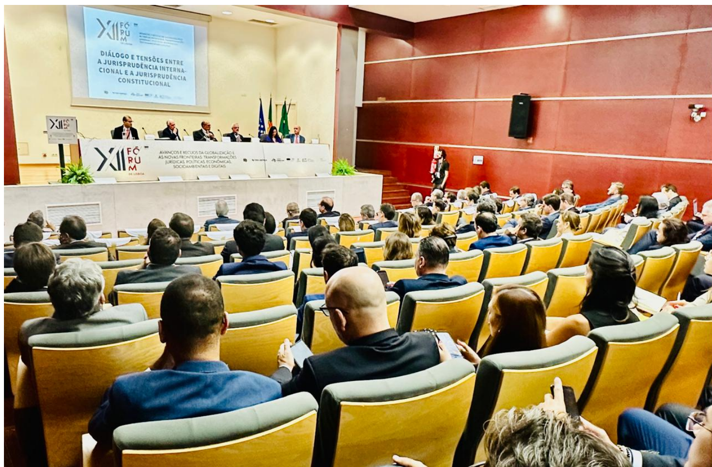
Plateia enche auditório em painel sobre jurisprudência internacional no Fórum de Lisboa ConJur