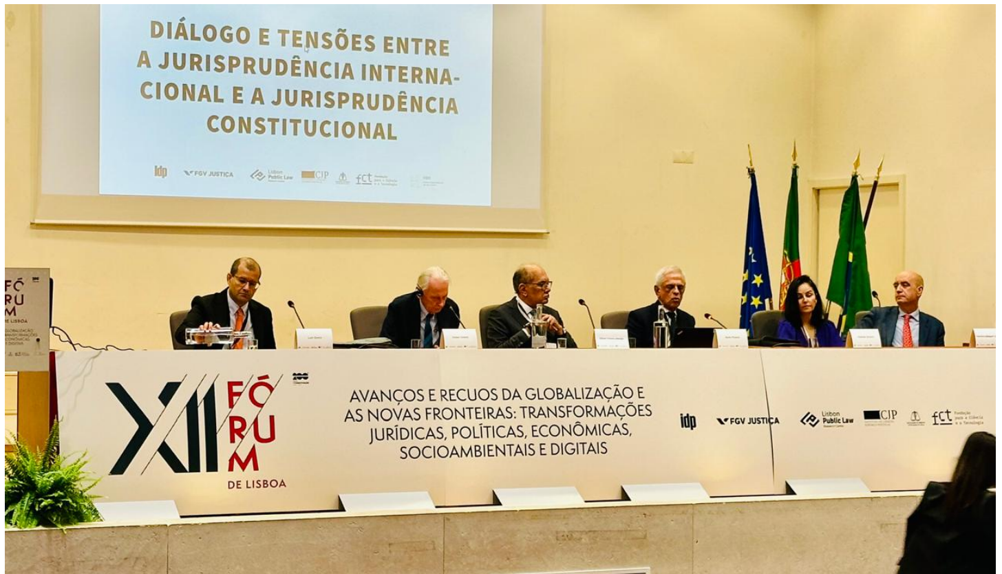
Mesa completa para debater tensões entre a jurisprudência constitucional ConJur