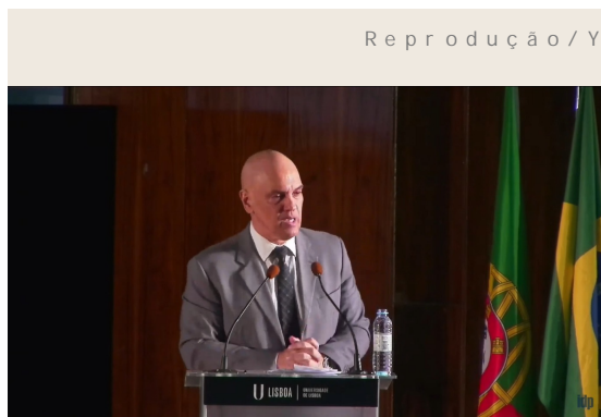
Ministro Alexandre de Moraes O Mundo em Eleições e o Futuro da Democracia Representada

O evento é organizado pelo Instituto Brasileiro de Direito e Política, pelo Lisbon Public Law Research Centre (LPL) da Faculdade de Direito da Universidade Nova de Lisboa e pelo Centro de Inovação, Administração e Políticas Públicas da FGV (FGV Justiça).