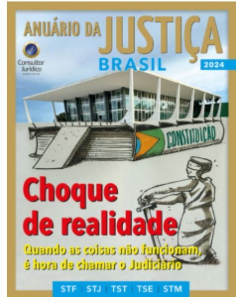
18ª edição do Anuário da Justiça Brasil

Os números falam por si: das 18.190 decisões do Plenário em 2023, 18.094 se deram em ambiente virtual; apenas 96, nas sessões presenciais de quartas e quintas-feiras à tarde. Isso equivale a 99,4% das decisões do Plenário. Nas turmas, o volume não é diferente. De 4.690 decisões da 1ª Turma, 4.672 foram de forma virtual (99,6%); na 2ª Turma, de 4.957, 4.938 foram no virtual. Com o mesmo percentual.