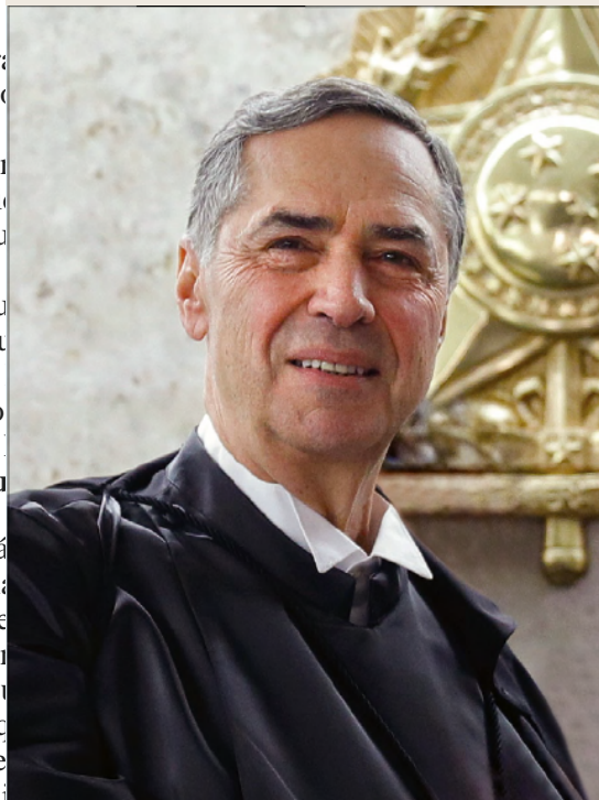
Barroso tem procurado investir parte do orçamento do STF em tecnologia