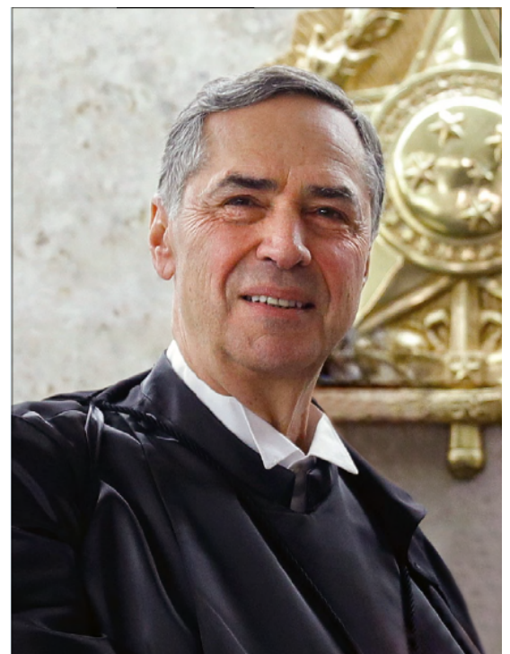
Resolução do CNJ determinou o julgamento com perspectiva de gênero em todo o Judiciário

Em 1º de agosto de 2023, coube ao STF, por unanimidade, pôr a pá de cal que faltava numa daquelas excrescências que perduravam em decisões judiciais Brasil afora: a tese da legítima defesa da honra em crimes de feminicídio ou de agressão contra mulheres. “Hoje, é preciso que isso [matar ou agredir em legítima defesa da honra] seja extirpado inteiramente”, afirmou em seu voto a ministra Cármen Lúcia. “Como disse, mais do que uma questão de constitucionalidade, tendo como base exatamente a dignidade humana, conforme aqui sustentado como fundamento dos votos até agora exarados, estamos falando de dignidade humana no sentido próprio, subjetivo e concreto de uma sociedade ainda hoje machista, sexista, misógina e que mata mulheres apenas porque elas querem ser o que são: mulheres donas de suas vidas”, resumiu a ministra.