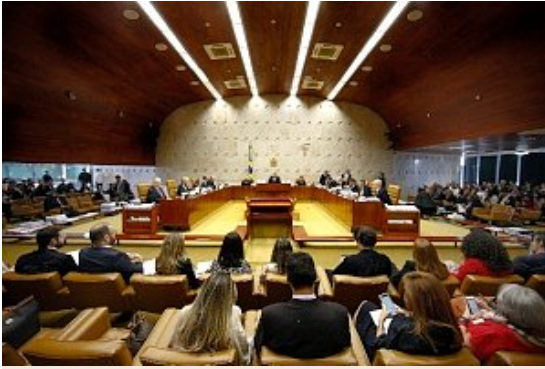
Plenário STF vai decidir sobre constitucionalidade da medida provisória do governo Lula

Também invocaram o Tema 345 dos repetitivos, que diz que as restrições posteriores ao direito de compensação não alcançam o crédito que foi reconhecido em ações judiciais propostas em datas pretéritas.