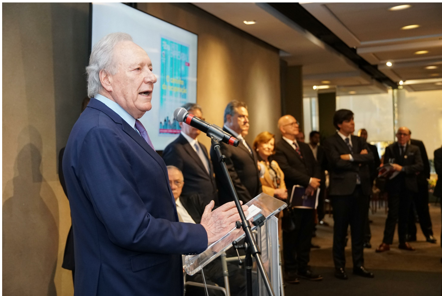
O Ministro Ricardo Lewandowski discursa durante o lançamento do Anuário Vseventeen