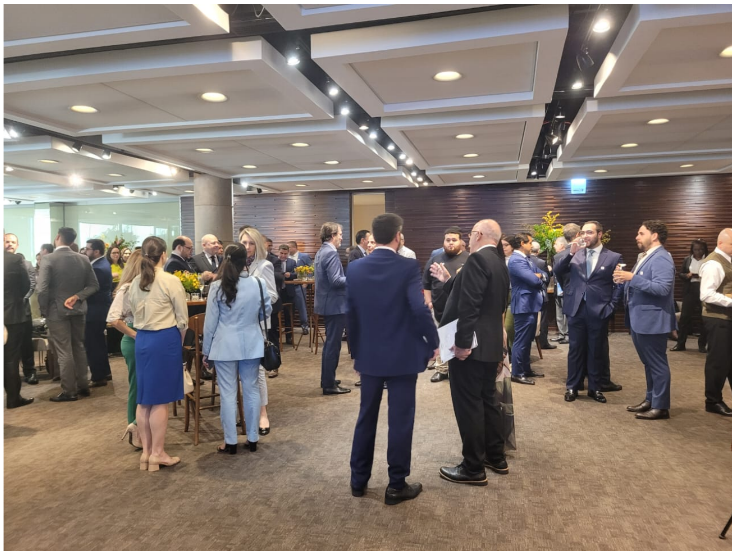
Público durante o coquetel que antecedeu o lançamento do Anuário ConJur