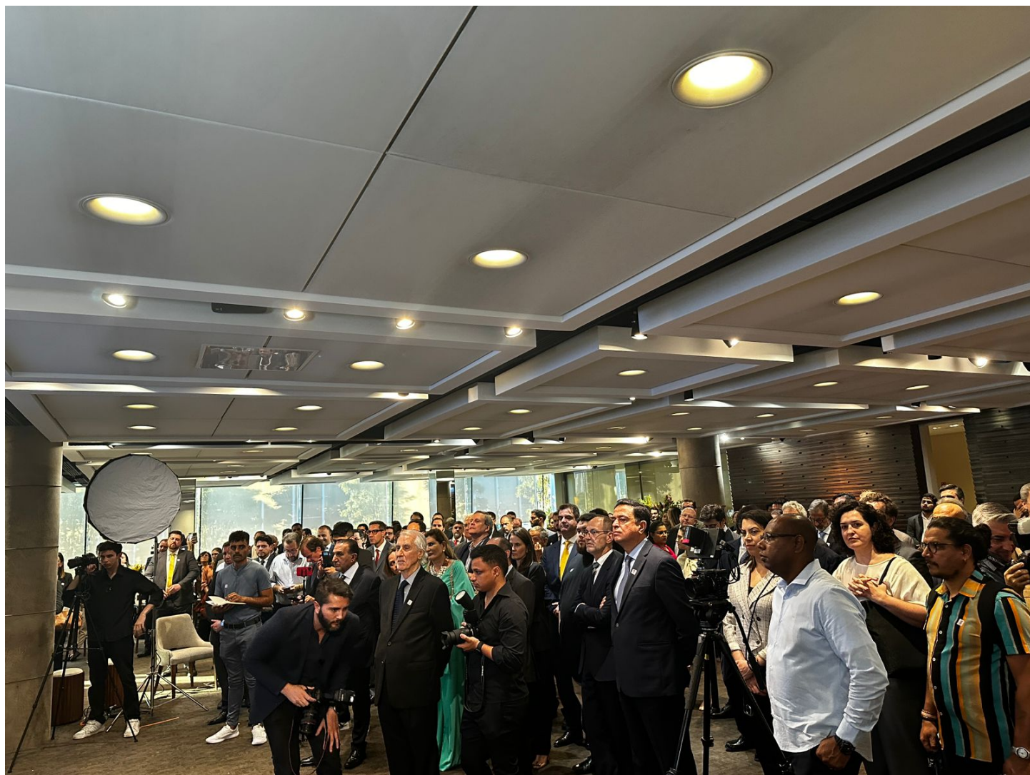
Plateia durante discursos no lançamento do Anuário da Justiça Direito Empresarial Vseventeen