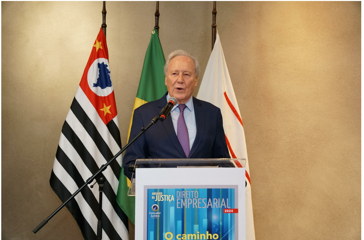
O Ministro Ricardo Lewandowski discursa durante o lançamento do Anuário Vseventeen