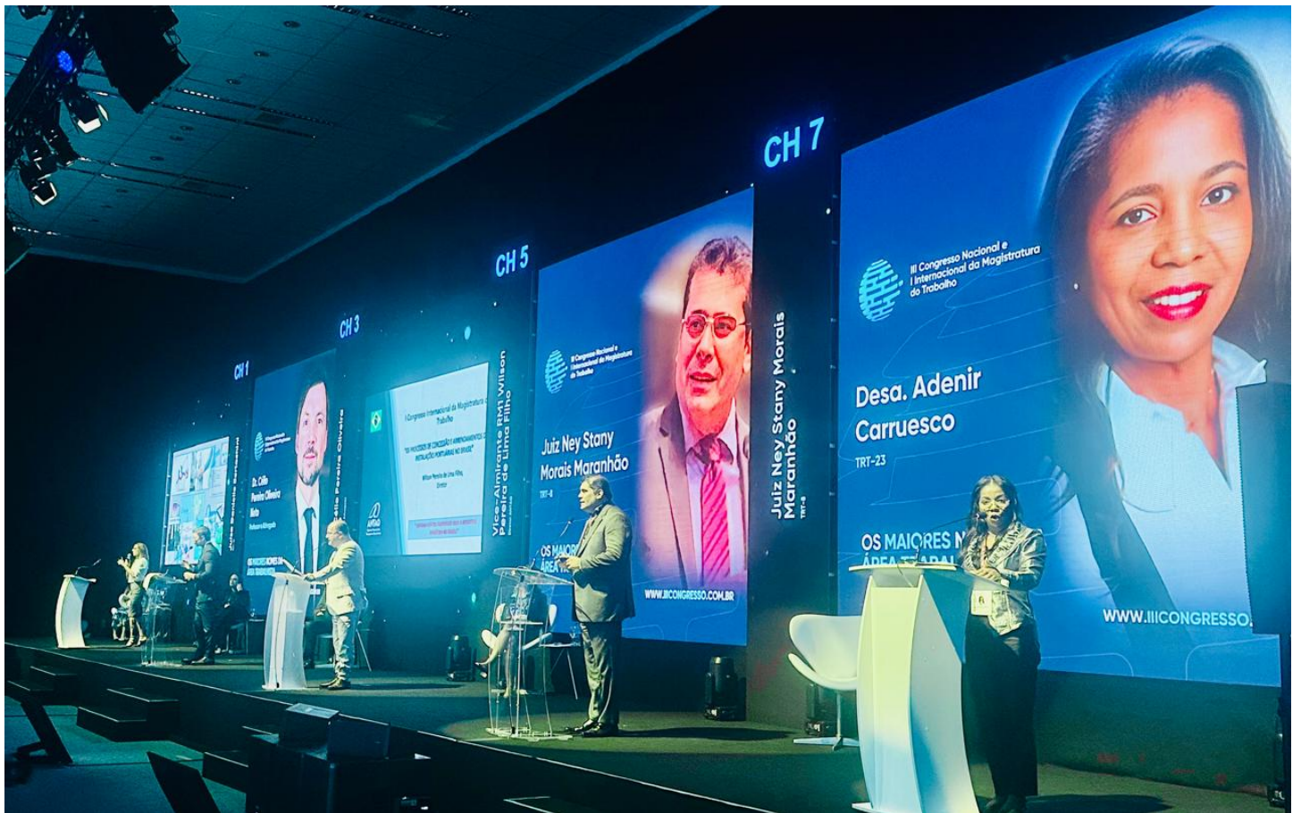
Evento em Foz do Iguaçu teve palestras simultâneas ConJur