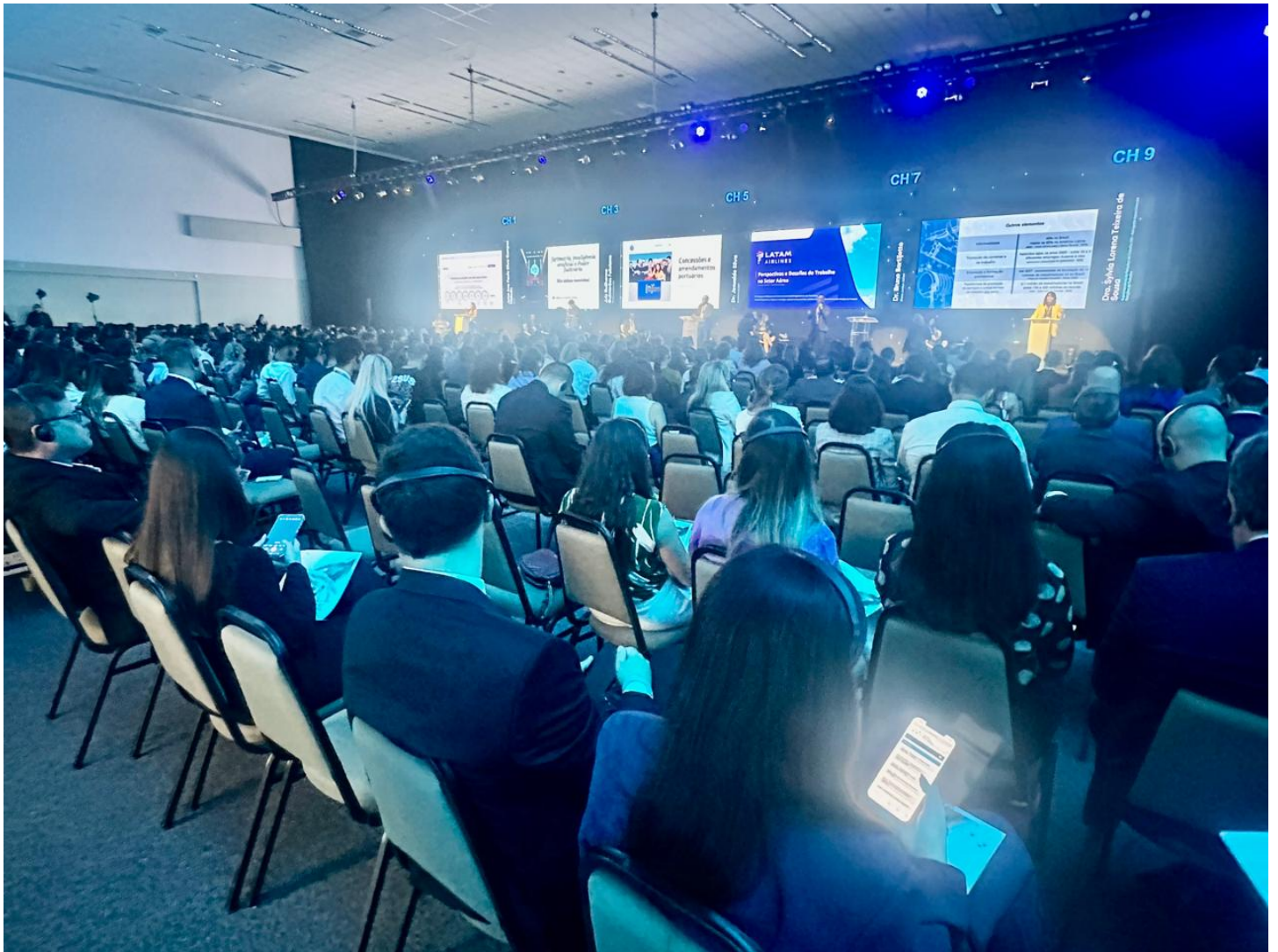
Auditório do evento ficou lotado durante as palestras ConJur