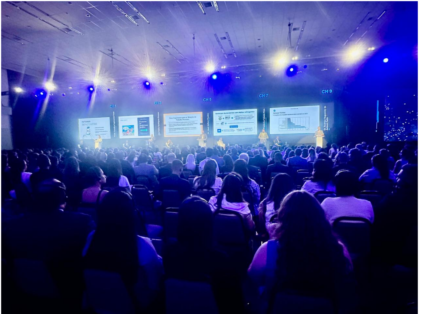
Auditório do evento ficou lotado durante as palestras ConJur