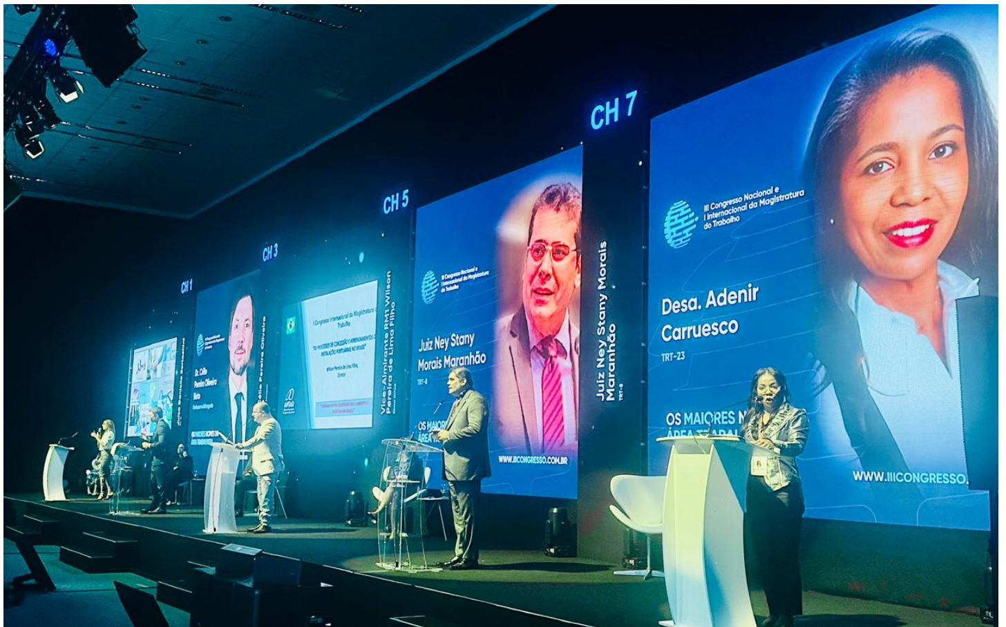
Evento em Foz do Iguaçu teve palestras simultâneas ConJur