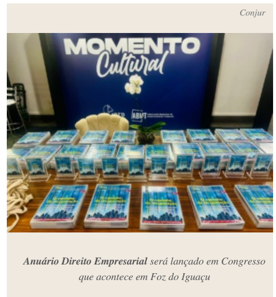
Anuário Direito Empresarial será lançado em Congresso que acontece em Foz do Iguaçu