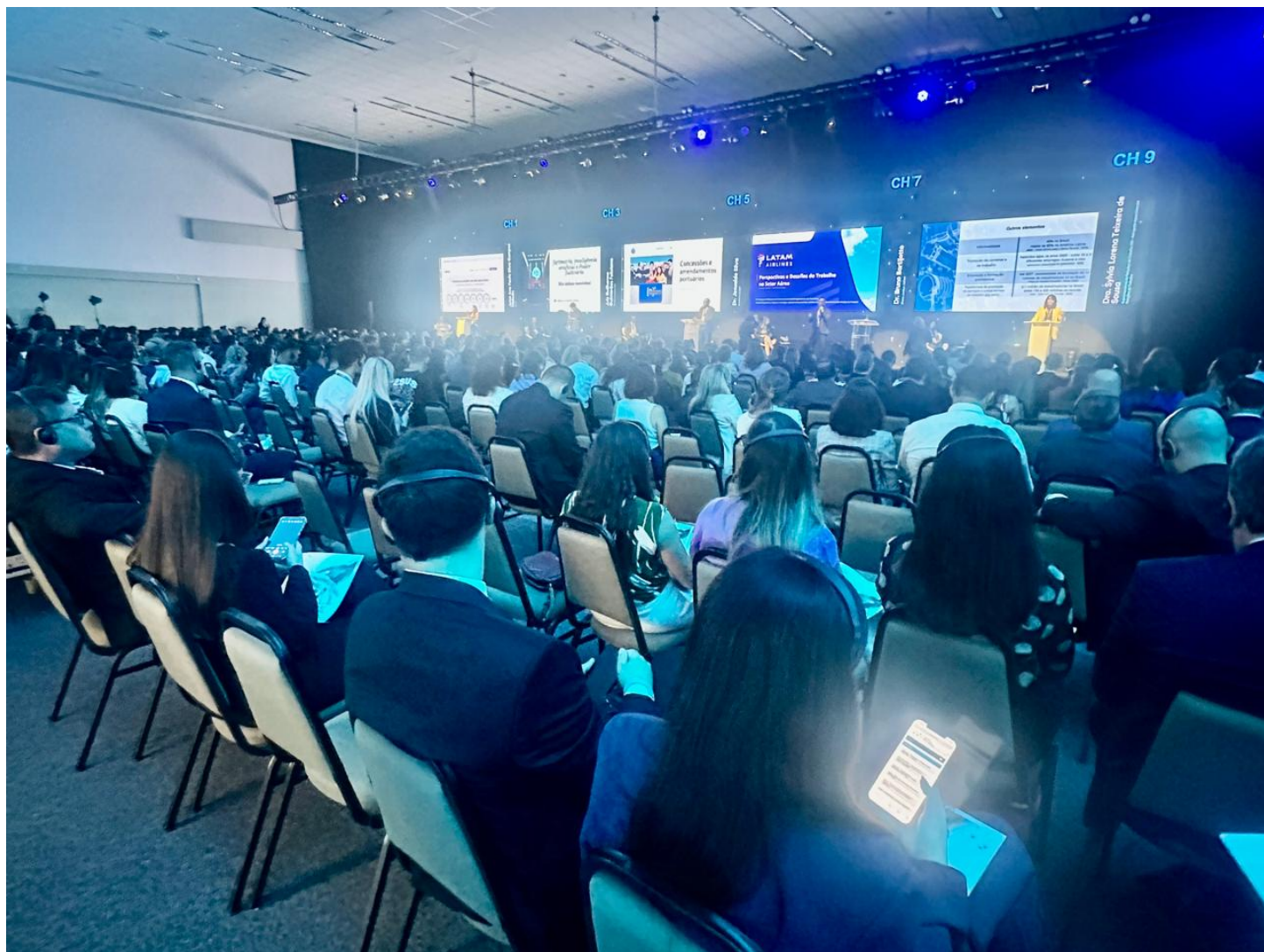
Auditório do evento ficou lotado durante as palestras ConJur