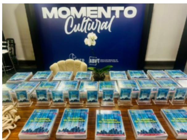
Anuário Direito Empresarial será lançado em Congresso que acontece em Foz do Iguaçu ConJur