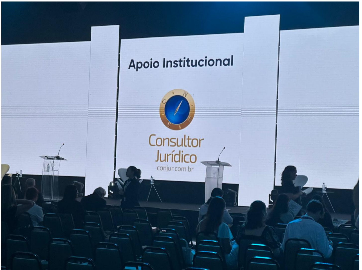
Congresso conta com apoio institucional da ConJur ConJur