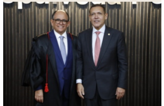
Ministros do TSE Antonio Carlos Ferreira (esquerda) e Nunes Marques