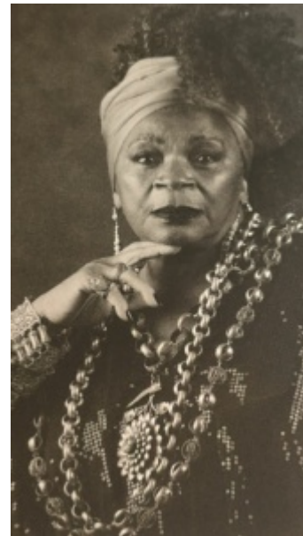
A atriz Zezé Motta