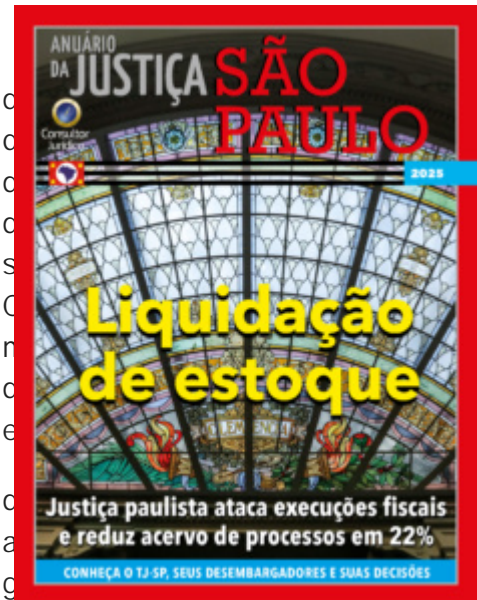
Capa da nova edição do Anuário da Justiça São Paulo