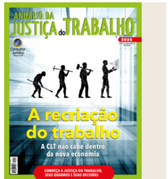
Capa da nova edição do Anuário da Justiça do Trabalho

Levantamento deste Anuário da Justiça , com dados do CNJ, mostra que os pedidos de reconhecimento de relação de emprego, assunto processual em que está inserida a maioria das demandas envolvendo os trabalhadores de plataformas, quase triplicaram em quatro anos. De 165,3 mil ações, em 2020, para 441,1 mil. Mais de 1,7 milhão de pessoas trabalhavam por meio de plataformas digitais em 2024, aumento de 25% em relação a 2022. Dados do IBGE revelam que o transporte de passageiros concentra a maior parcela desses trabalhadores (964 mil pessoas), seguidos pelos entregadores de comida e encomendas (485 mil) e pelos prestadores de serviços profissionais (294 mil).