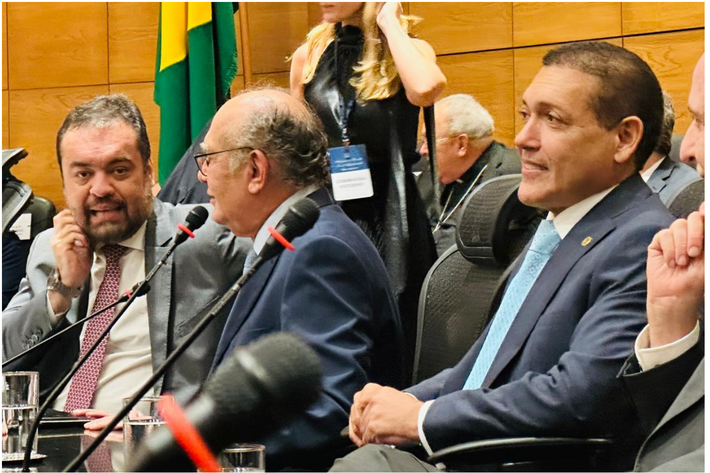
Cláudio Castro, Gilmar Mendes e Kassio Nunes Marques