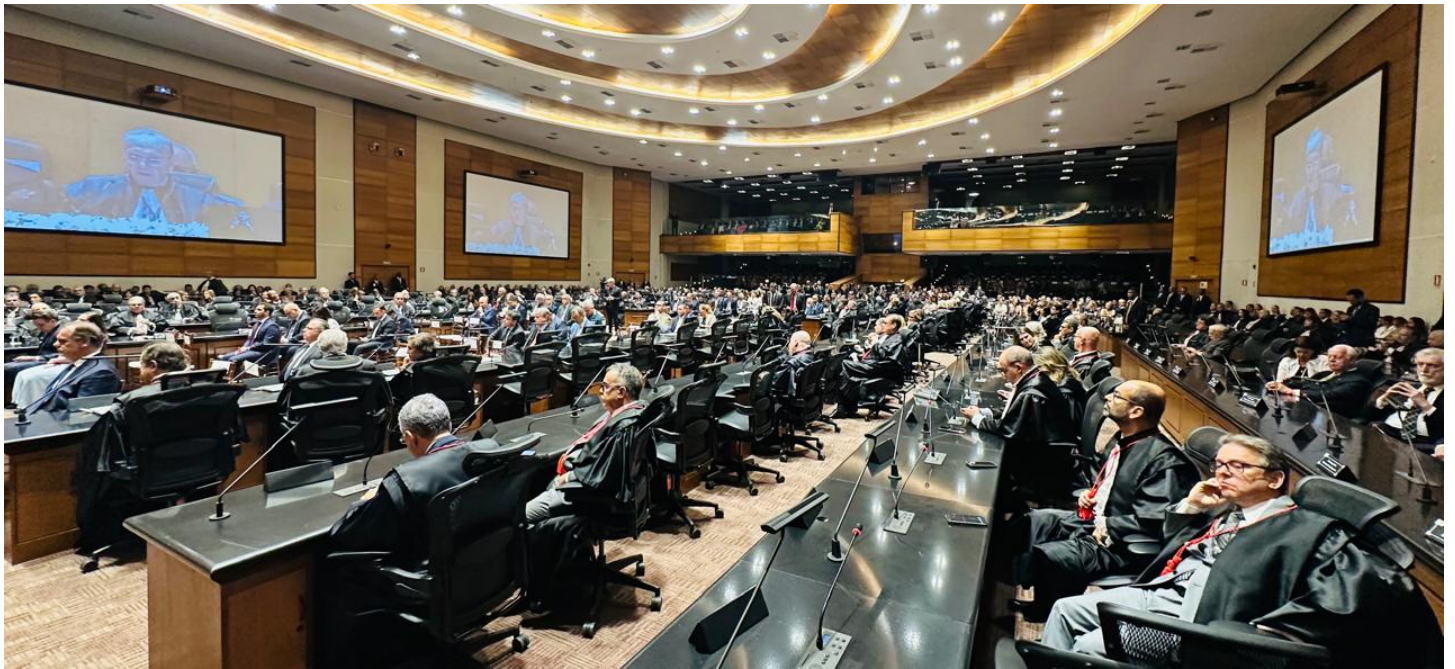
Auditório ficou repleto na cerimônia de posse no TJ-RJ ConJur