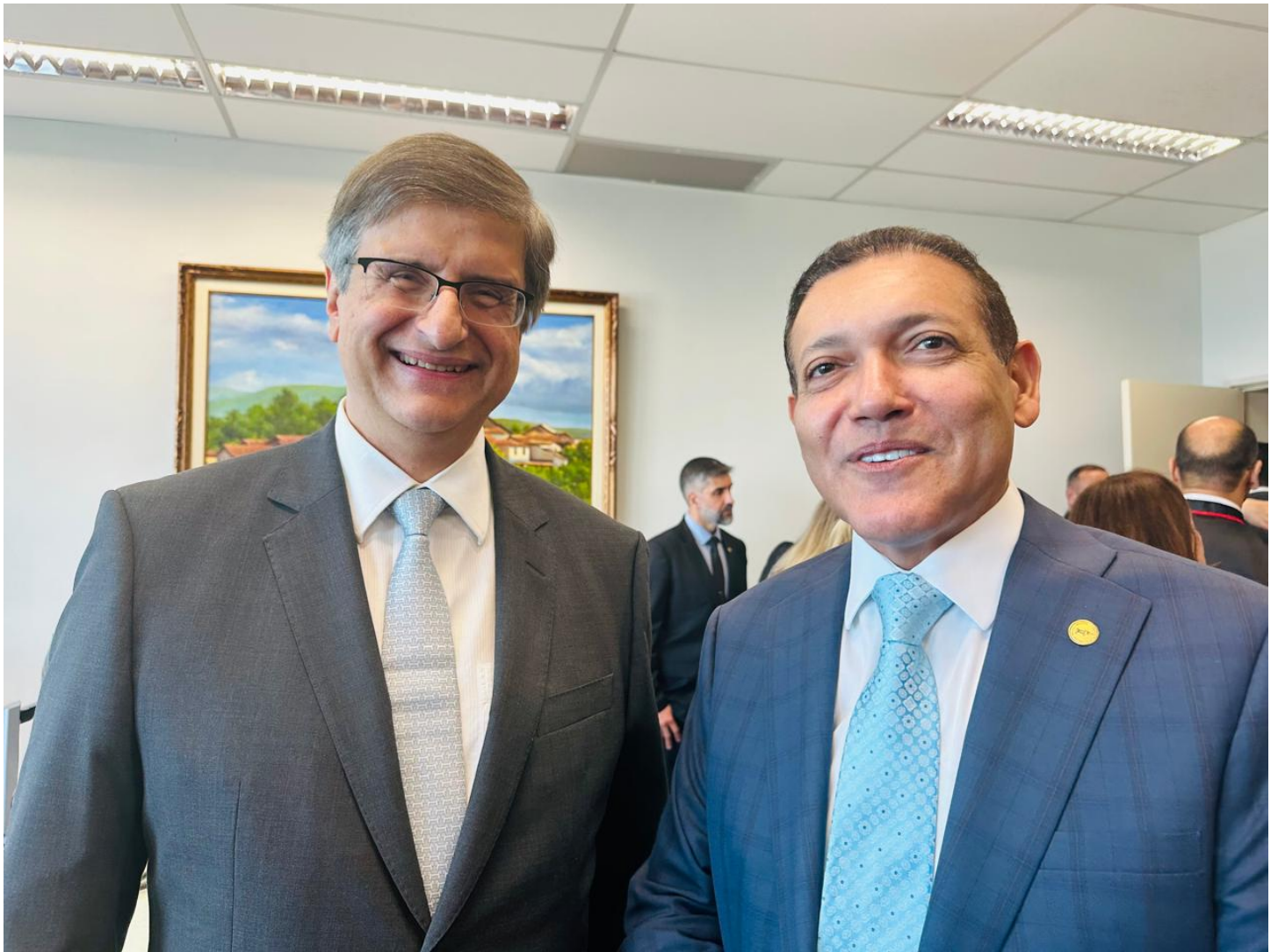
Paulo Gonet e Kassio Nunes Marques