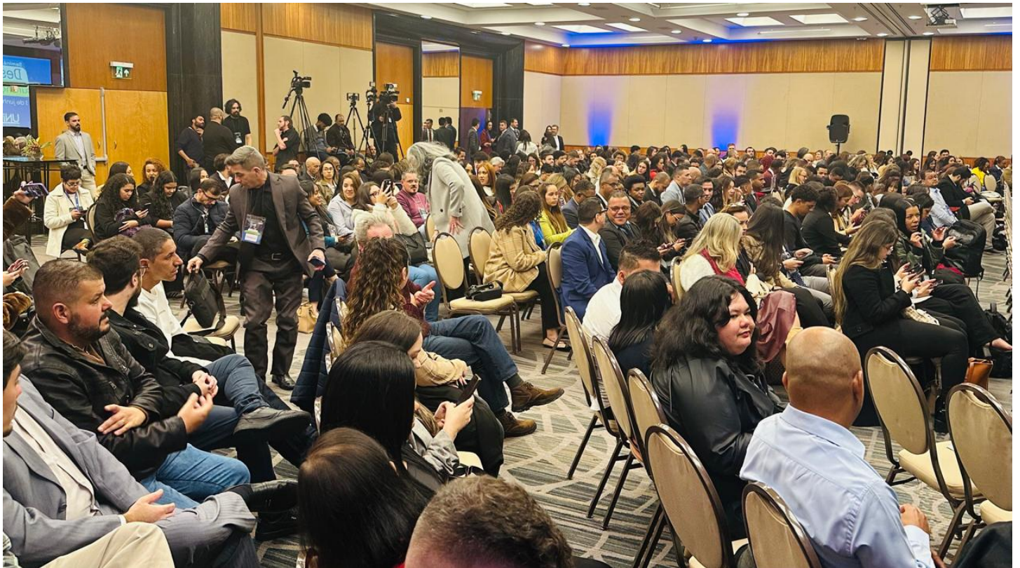
Público durante o seminário sobre segurança na Unisa ConJur