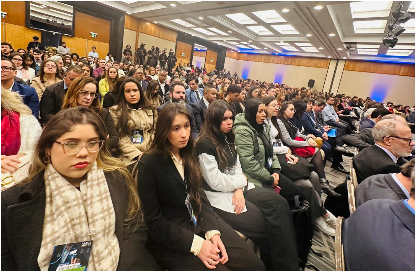
Público durante o seminário sobre segurança na Unisa ConJur