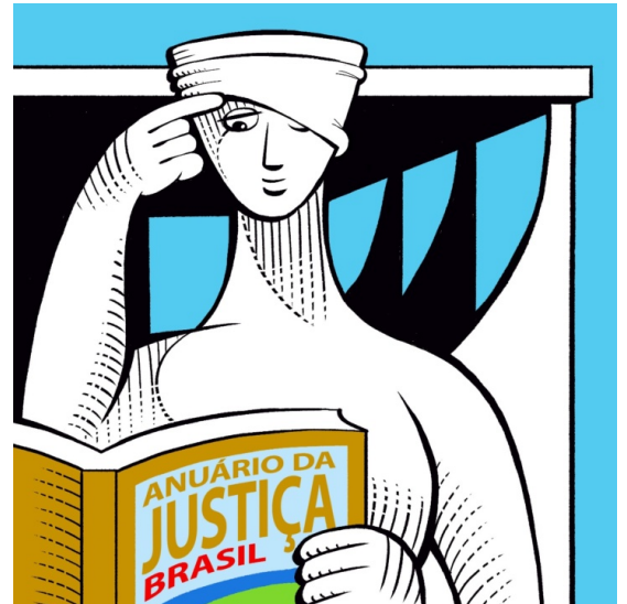
Ilustração criada por João Spacca | @joao.spacca