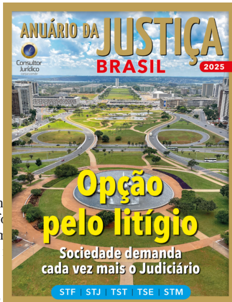
Capa da nova edição do Anuário da Justiça Brasil 2025

Por exemplo, o reconhecimento do vínculo de emprego entre motoristas de aplicativo e as plataformas. A ‘uberização’ teve repercussão geral reconhecida (Tema 1.291) e o processo envolvendo o caso ainda tramita no Plenário Virtual (RE 1.446.336). A expectativa recai sobre os votos de Flávio Dino, que ainda não se manifestou sobre o tema, e de Edson Fachin, relator do recurso, que tende a levar em conta impactos sociais na análise de matérias que envolvem direitos trabalhistas.