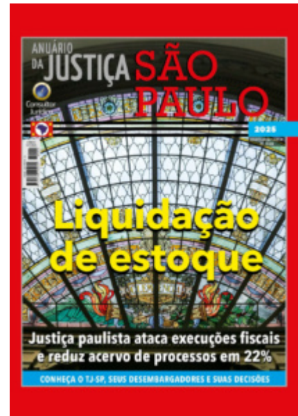
Capa da nova edição do Anuário da Justiça São Paulo