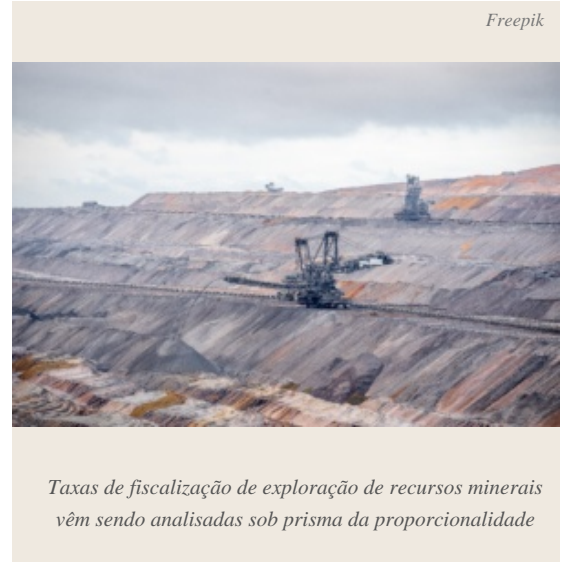
Taxas de fiscalização de exploração de recursos minerais vêm sendo analisadas sob prisma da proporcionalidade