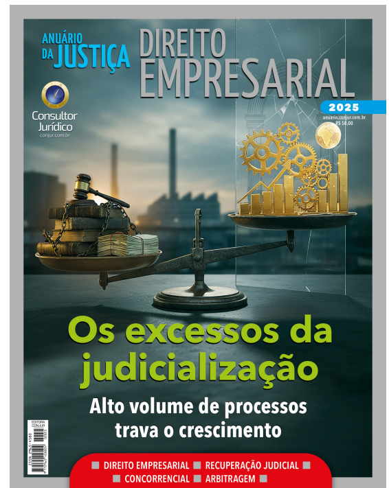
Capa da nova edição do Anuário da Justiça Direito Empresarial

Em 2025, a Pesquisa Fusões e Aquisições da KPMG mostrou uma queda de 5% na quantidade de operações no primeiro semestre do ano, se comparado com o mesmo período de 2024. Foram 739 operações em 2025 contra 776 em 2024. “A retração no primeiro semestre de 2025 parece estar ligada a uma conjuntura mais cautelosa, marcada por juros ainda elevados, volatilidade cambial e desenvolvimento em política nacional e internacional que afetam diretamente o ambiente de negócios”, explica Fonseca. “Essa oscilação não é incomum em mercados emergentes,