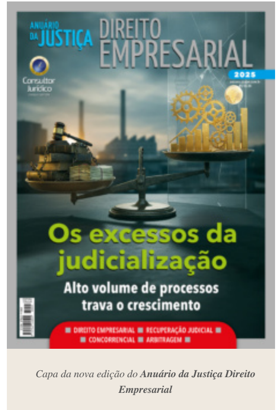
Capa da nova edição do Anuário da Justiça Direito Empresarial

Uma preocupação do órgão antitruste no mercado digital é se os modelos de inteligência artificial atuais cometem condutas anticompetitivas, especialmente no que diz respeito ao treinamento de inteligência artificial usando propriedade intelectual de terceiros sem autorização. “Empresas de IA estão treinando seus modelos em cima do conteúdo de agências