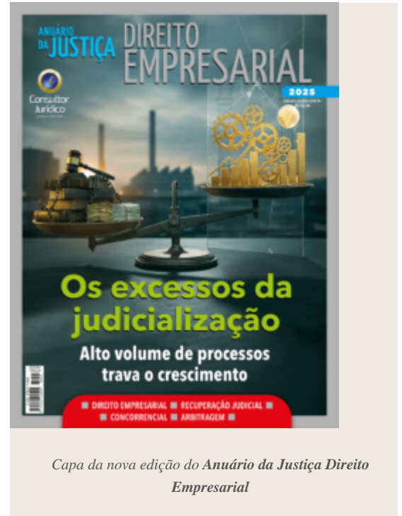
Capa da nova edição do Anuário da Justiça Direito Empresarial

Para empresas de setores específicos, como o de comércio exterior, ainda não se sabe muito bem o que ocorrerá com os benefícios de ICMS. Apesar de ser um dos últimos a serem extintos, os benefícios ligados ao imposto estadual estão no centro da estrutura de funcionamento desses contribuintes.