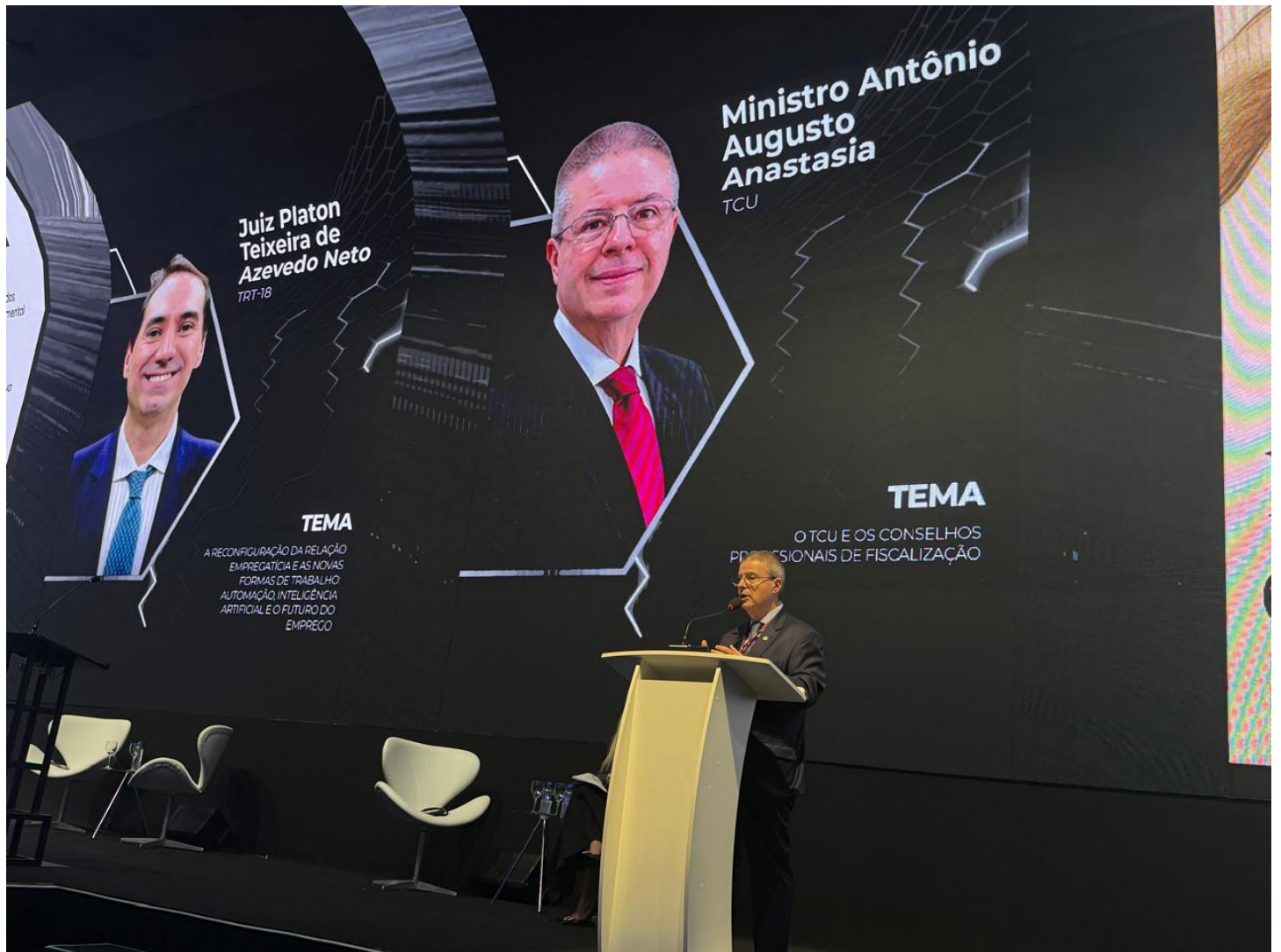
O ex-governador e ministro do TCU, Antonio Anastasia, discursa no evento ConJur