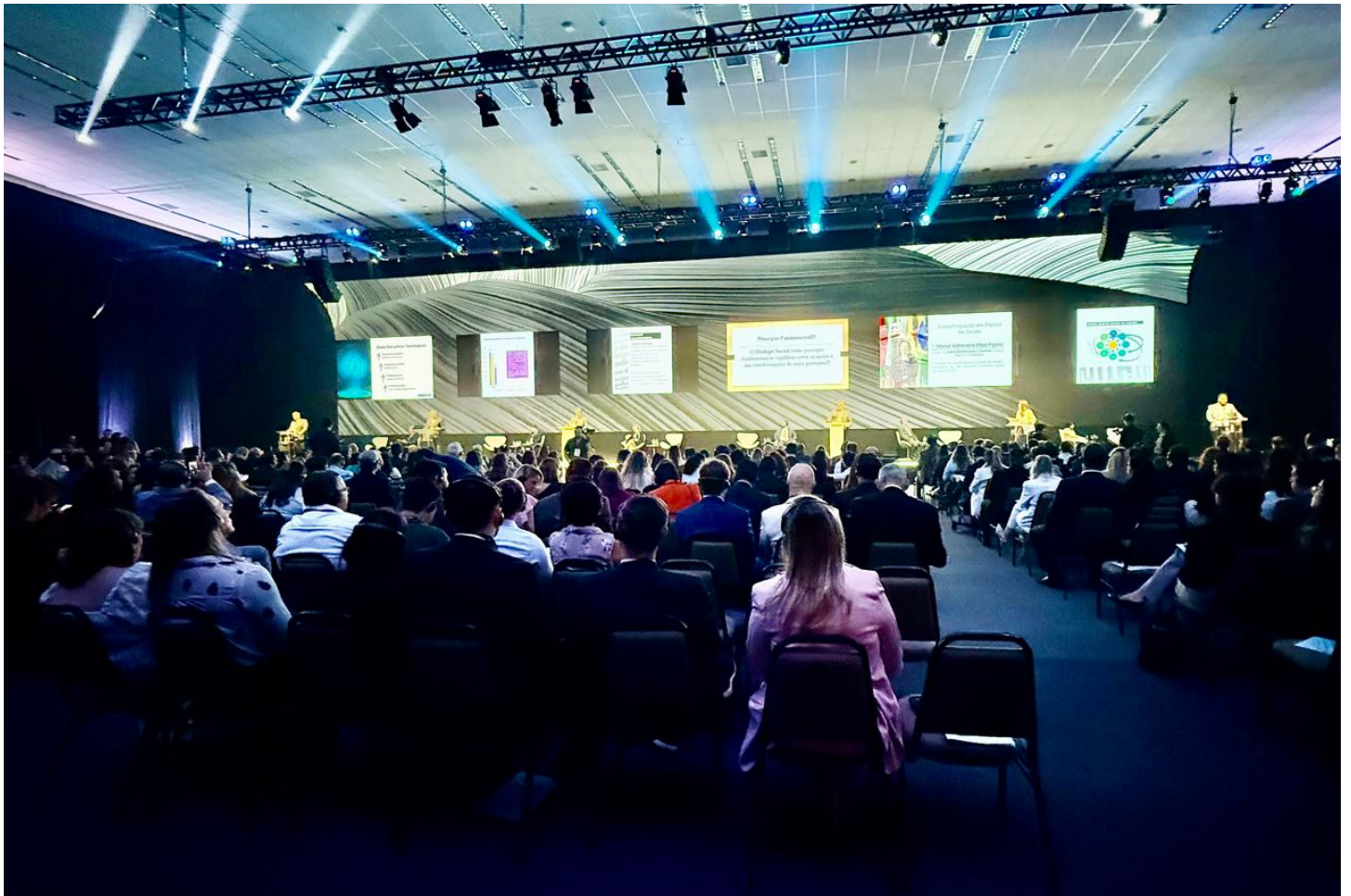
Público durante o IV Congresso Nacional e II Internacional da Magistratura do Trabalho