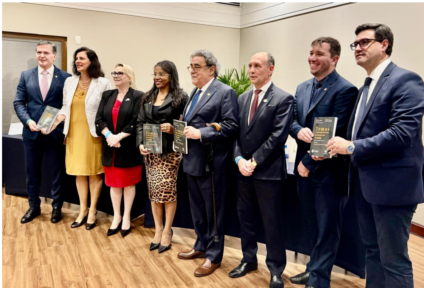
Livro em homenagem ao ministro Aloysio Corrêa da Veiga, do TST, foi lançado no evento