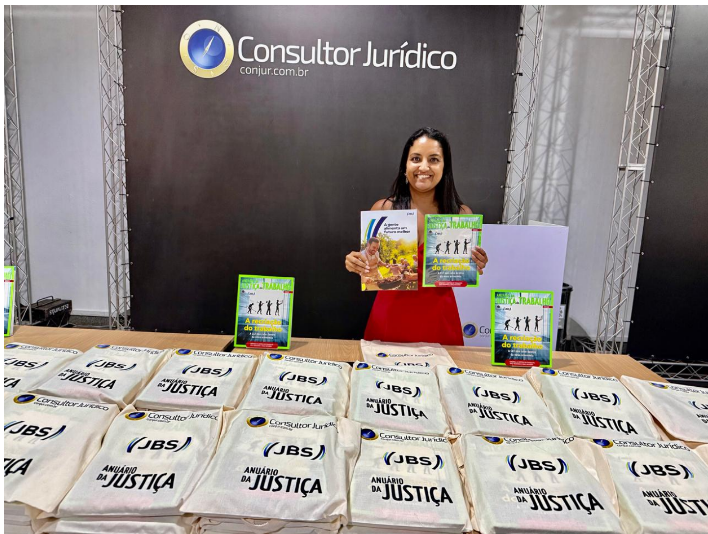
O Anuário da Justiça do Trabalho 2025 foi lançado durante o congresso ConJur