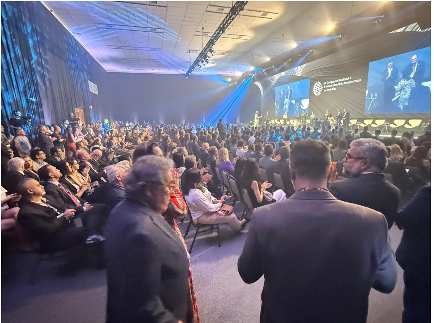
Público durante o IV Congresso Nacional e II Internacional da Magistratura do Trabalho