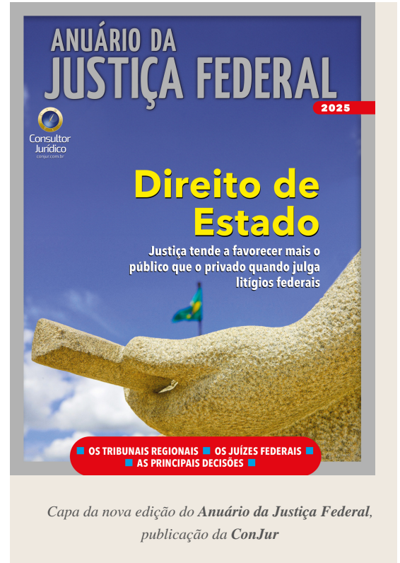
Capa da nova edição do Anuário da Justiça Federal , publicação da ConJur

É nesse contexto que entra o Gabinete de Conciliação, responsável por buscar a autocomposição na solução de ações cíveis que sobem à corte. O órgão mira demandas coletivas (ações civis públicas, ações coletivas), processos nos quais a Caixa Econômica Federal seja parte e ações previdenciárias. Em 2024, os casos solucionados pelo gabinete de conciliação aumentaram 108% (de 195 para 406).