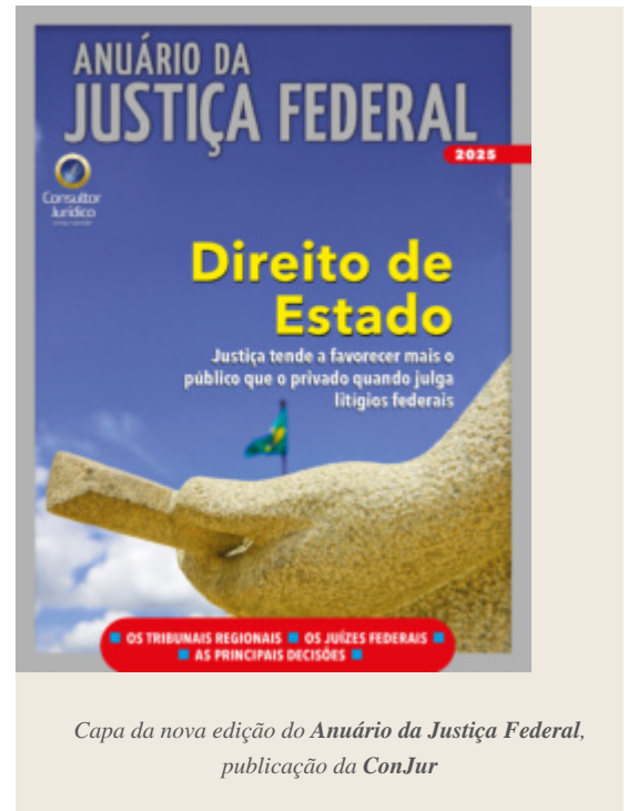
Capa da nova edição do Anuário da Justiça Federal , publicação da ConJur

O Ministério Público Federal é o órgão do MP da União com maior capilaridade no país. Tem uma estrutura que conta com a Procuradoria-Geral da República, em Brasília, e seis Procuradorias Regionais da República, que atuam junto aos Tribunais Regionais Federais, alcançando todos os estados do país e 125 municípios.