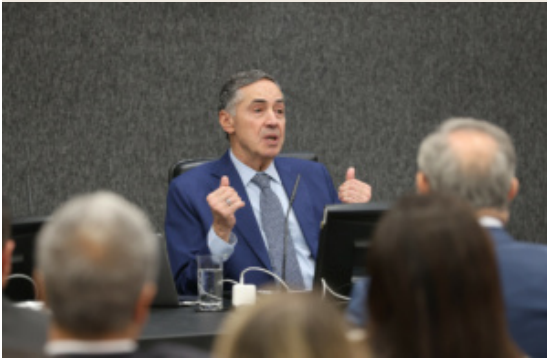
Barroso comemorou redução do acervo e produtividade registrada em 2024

Esse resultado está no relatório “Justiça em Números 2025”, preparado pelo Conselho Nacional de Justiça e apresentado nesta terça-feira (23/9), dia da última sessão do ministro Luís Roberto Barroso na presidência do órgão. Ele será sucedido pelo ministro Edson Fachin na segunda-feira (29/9).