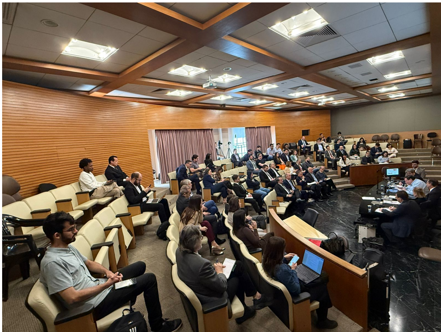
Simpósio é promovido no Auditório Rubino de Oliveira da FDUSP ConJur