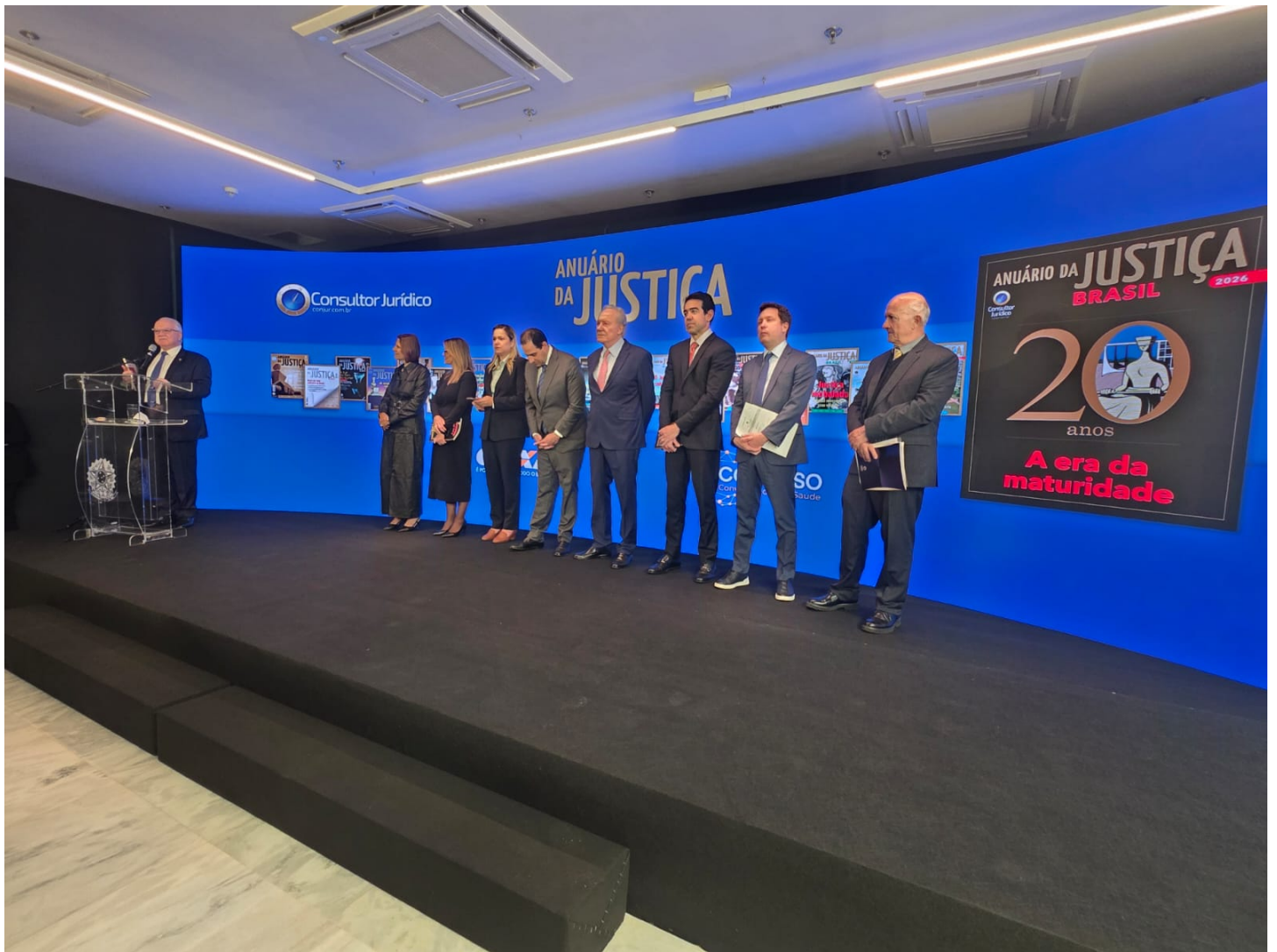
Edson Fachin discursa no evento de lançamento