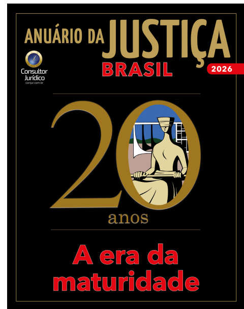
Capa do Anuário da Justiça Brasil 2026