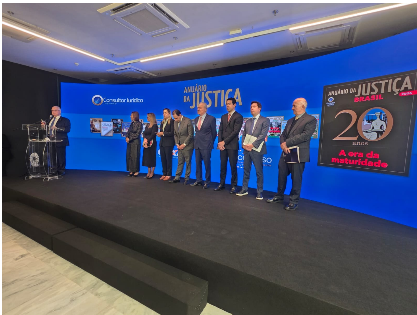
Edson Fachin discursa no evento de lançamento