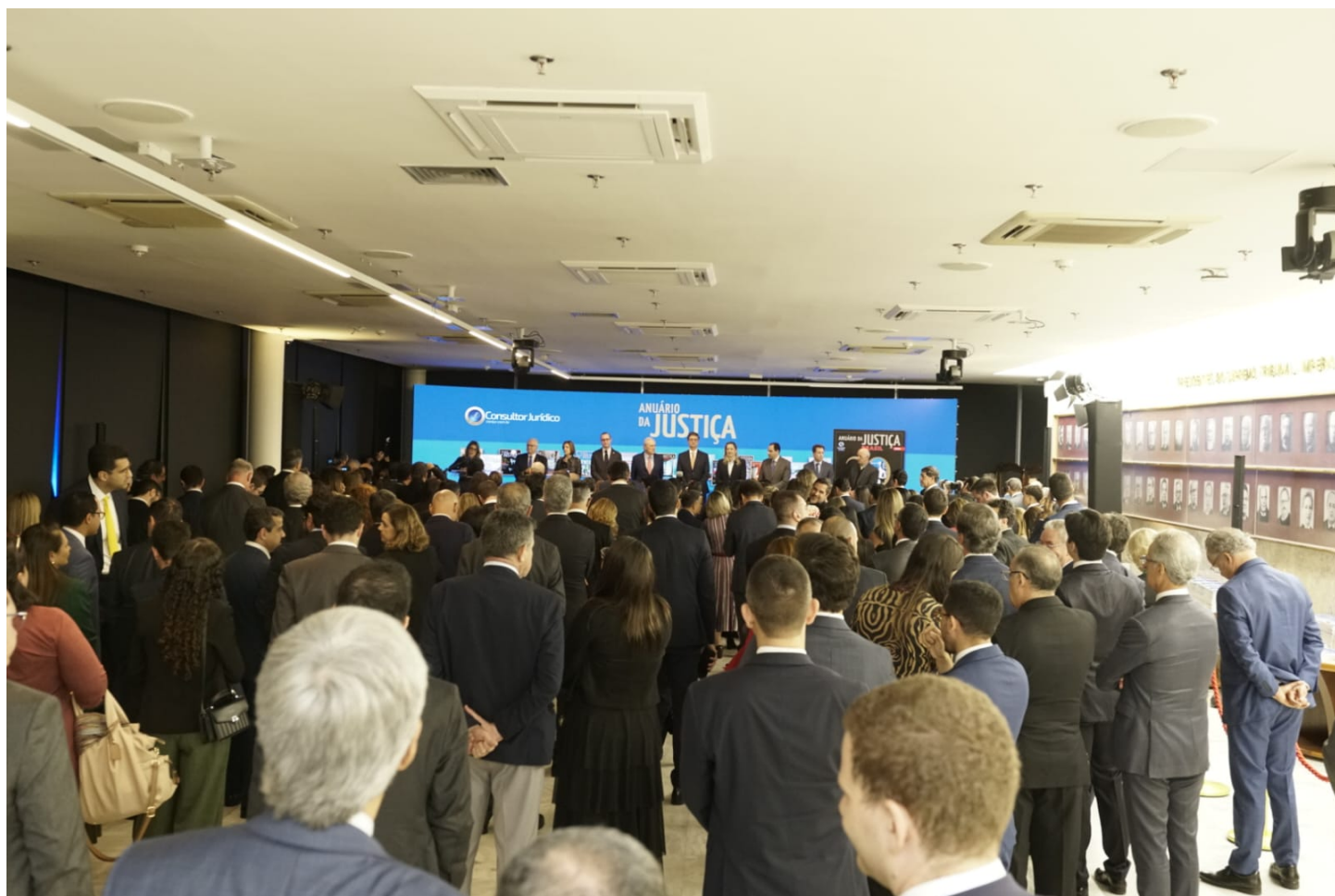
Salão Branco do STF ficou lotado no evento de lançamento ConJur